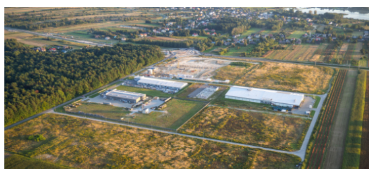
Kraśnicka Strefa Inwestycji.