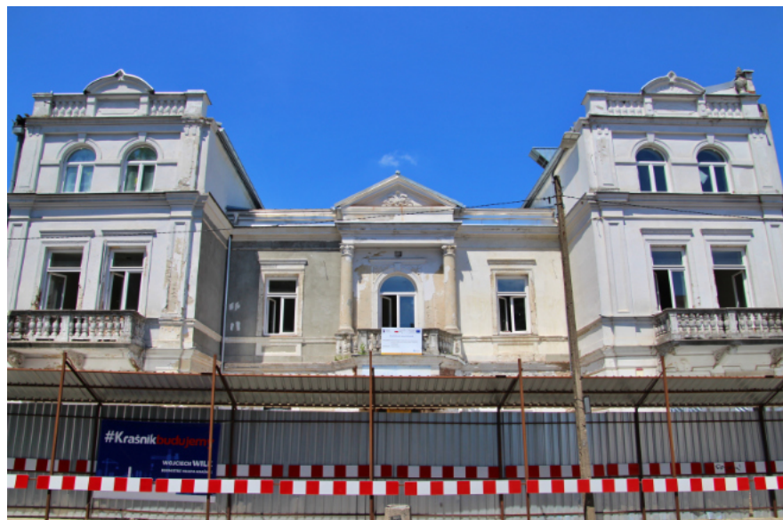
Przebudowa zabytkowej kamienicy na ul. Kościuszki