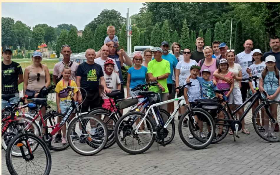
Famijny Rajd Rowerowy