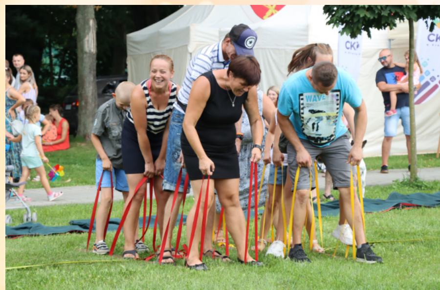
Zabawa na Festiwalu Familijnym w Parku św. JPiI