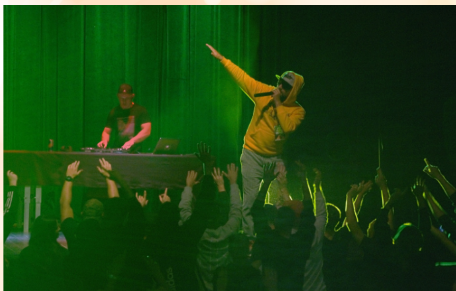
Koncert donGURALesco w CKiP