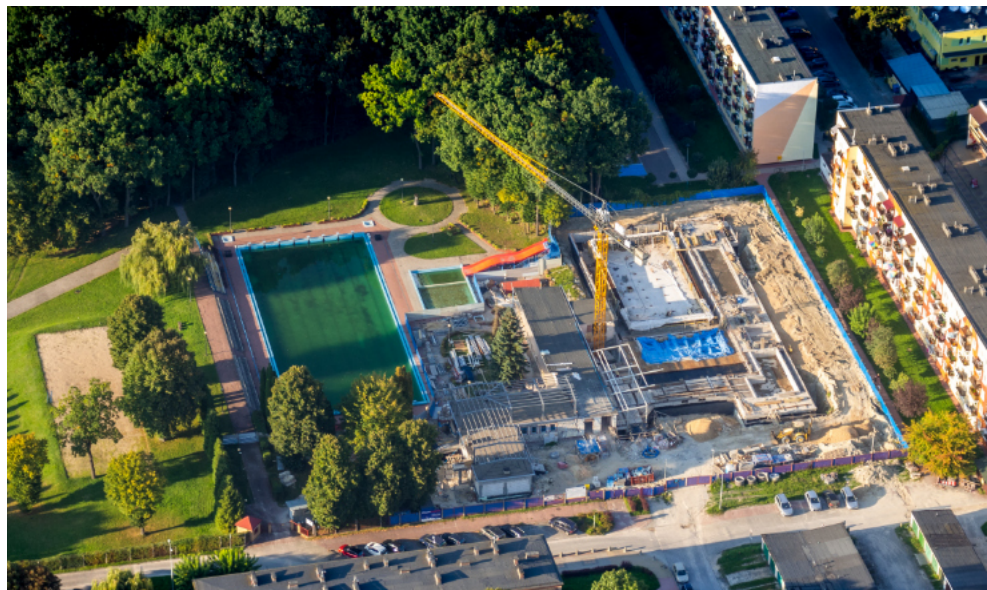
Budowa nowej krytej pływalni na MOSiR