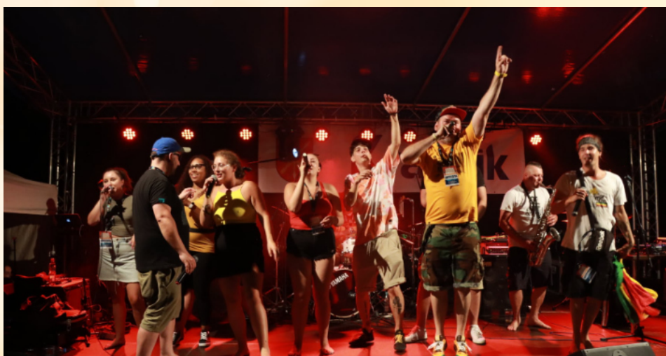
Reggae Night nad Zalewem