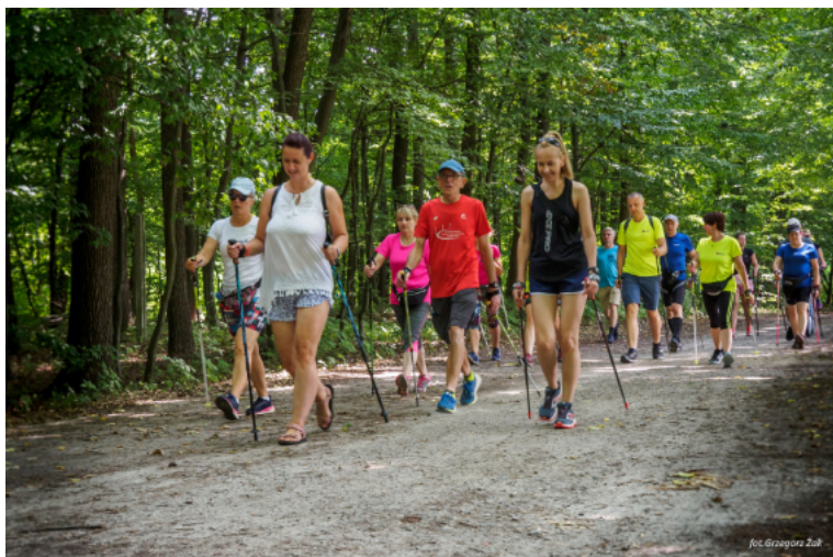
Nordic walking jest coraz bardziej popularny wśród kraśniczan.