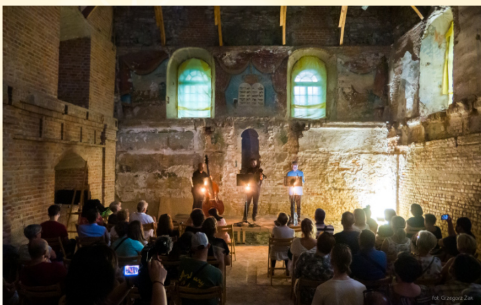
Festiwal Singera w kraśnickiej synagodze