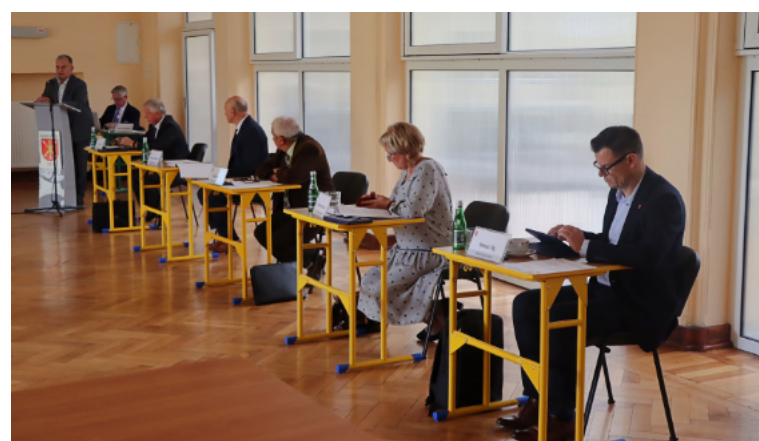
Będą mieszkania czynszowe dla kraśniczan.

ne kredyty w Banku Gospodarstwa Krajowego. W 10-20% kosztów budowy lokalu mają partycypować najemcy. Będą oni mieli możliwość wykupu takiego mieszkania po upływie 15 lat (wniesiony wkład byłby zaliczany na poczet wykupu mieszkania). Jeżeli ktoś nie będzie chciał wykupić mieszkania, a dokonał wkładu własnego, to po 5 latach będzie mógł starać się o jego zwrot poprzez obniżenie wysokości czynszu najmu.