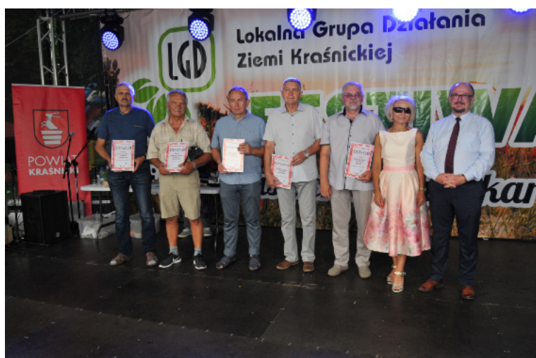
W Kraśniku jest aż 6 Rodzinnych Ogrodów Działkowych.

W Kraśniku jest ponad 800 działek na 6 ogrodach działkowych. Dla wszystkich właścicieli i ich rodzin są one prawdziwymi skarbami, dzięki którym mogą wypoczywać, miło spędzać czas na świeżym powietrzu, wreszcie uprawiać smaczne, zdrowe owoce i warzywa. Nieprzypadkowo przedstawiciele kraśnickich Rodzinnych Ogrodów Działkowych gościli 18 lipca na Festiwalu „Ziemia Kraśnicka Pełna Skarbów”, zorganizowanym przez Lokalną Grupę Działania Ziemi Kraśnickiej kierowaną przez Wioletę Wilkos .