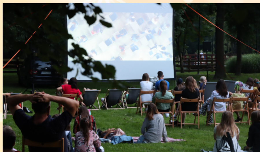
Kino plenerowe w Parku św. JPiI