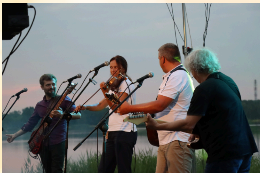
Szanty nad Zalewem Kraśnickim