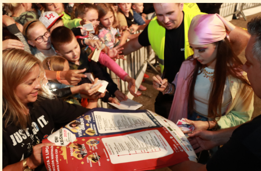
Koncert Viki Gabor