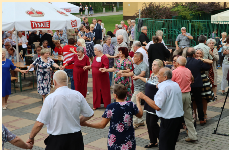
Senior Fest, scena letnia CKiP