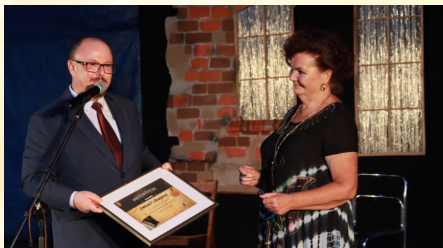
V Przegląd Kapel Podwórkowych