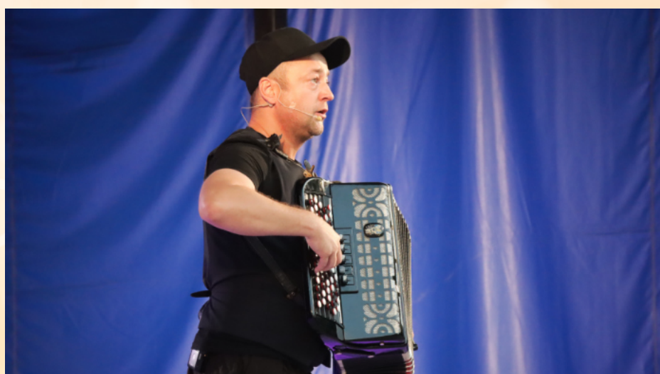
Koncert Czesława Mozila na BOOM Festiwal Kraśnik