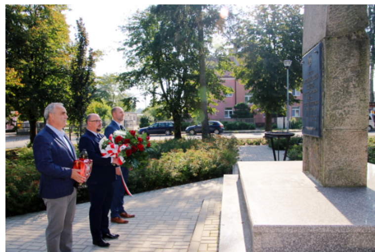
Przedstawiciele miasta złożyli kwiaty pod pomnikiem kolejarzy.

Na początku września 1939 r. na Kraśnik i okolice spadły niemieckie bomby. Zginęły dziesiątki kraśniczan. W rocznicę tych tragicznych wydarzeń w kościele pw. WNMP odprawiona została msza św. w intencji ofiar niemieckiej okupacji.