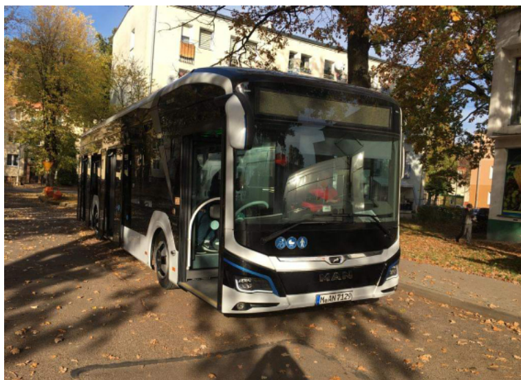
Pierwsze autobusy elektryczne wyjadą na ulice w 2023 r.

Kilka miesięcy temu Rada Miasta zgodziła się na dokapitalizowanie Miejskiego Przedsiębiorstwa Komunikacyjnego kwotą 1 650 000 zł. Przekazane środki posłużą na wkład własny do projektu „Poprawa jakości usług w komunikacji miejskiej i ja-