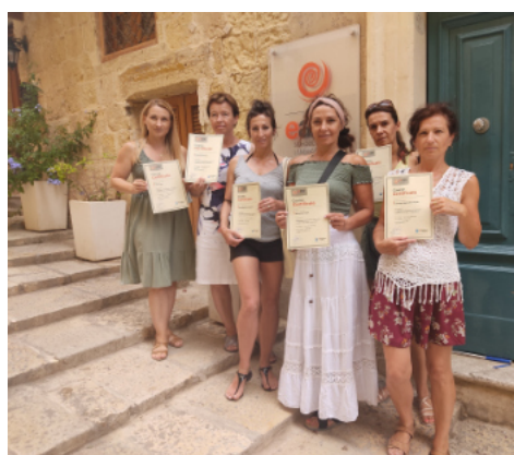
Nauczycielki z kraśnickiego Przedszkola nr 2 będą uczyć swoich podopiecznych języka angielskiego.

Warunkiem dobrej znajomości języków obcych jest wczesna edukacja. Dzięki unijnemu wsparciu do prowadzenia takich zajęć przygotowują się nauczyciele z Przedszkola Miejskiego nr 2 w Kra-