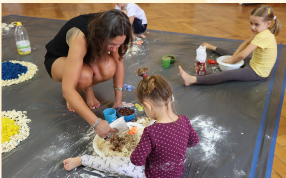
Zajęcia z sensoplastyki w CKiP