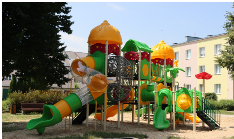
Plac zabaw na ul. Chopina