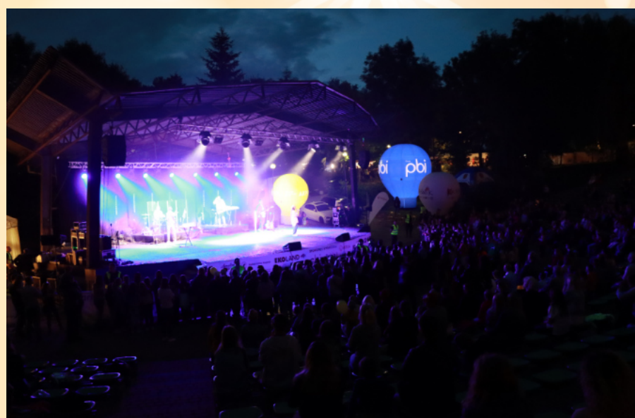
Dni Kraśnika w amfiteatrze