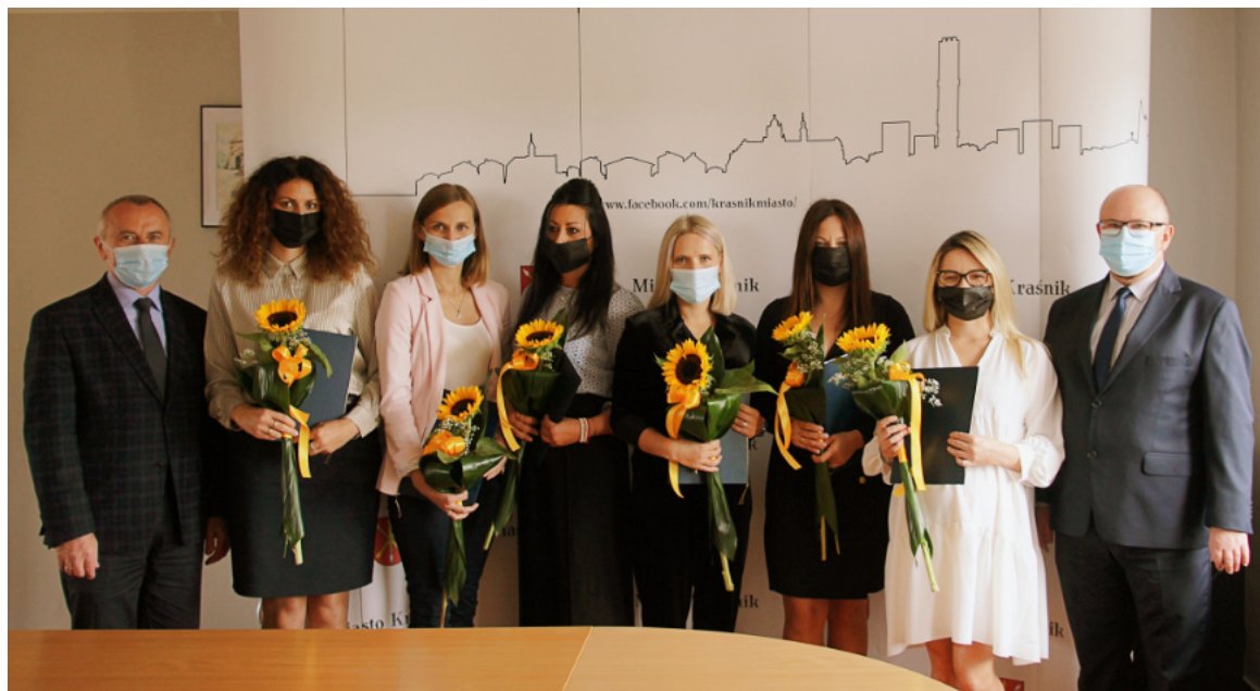
Siedmioro nauczycieli z miejskich szkół otrzymało awans zawodowy z rąk burmistrza.