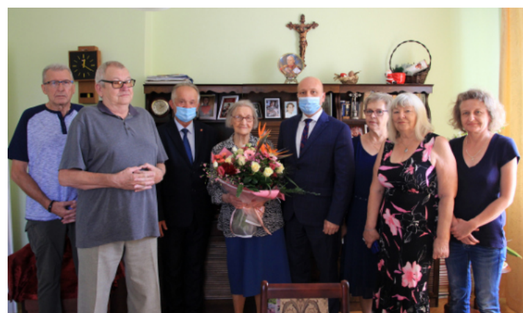
Jubileusz 100-lecia urodzin.