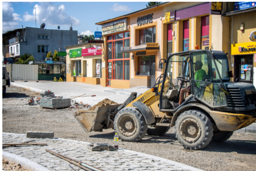
Przebudowa ronda Żołnierzy Wyklętych