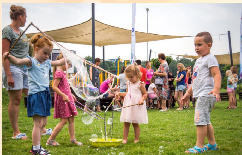
Dużą popularnością cieszyły się animacje osiedlowe organizowane przez CKiP