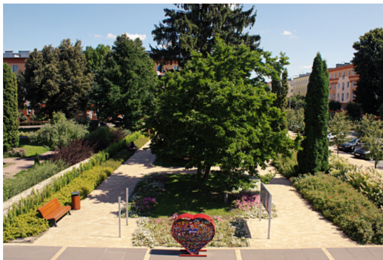
Gwiazdy sportowców zostaną wmurowane na reprezentacyjnym skwerze przed CKiP.

Cała czwórka to nie tylko kraśnicy mistrzowie w swoich dyscyplinach, ale przede wszystkim uczestnicy Igrzysk Olimpijskich: - Członkowie kapituły uznali, że właśnie taki klucz wyboru będzie w pierwszym, inauguracyjnym roku najlepszy, bowiem doceniamy w