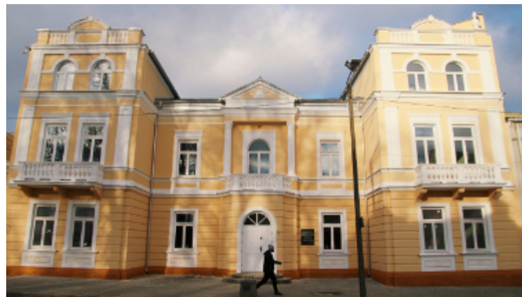
Tak prezentuje się front kamienicy przy ul. Kościuszki 26.

W kamienicy siedzibę będzie miała harcówka, sala prób orkiestry OSP oraz izba pamięci. W projekcie rewitalizacji przewidziano miejsce na kawiarnię i gabinety lekarskie.