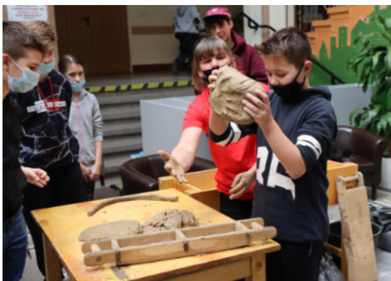
Odsłonięciu pieca towarzyszyły warsztaty z ceramiki, które odbyły się w CKiP.