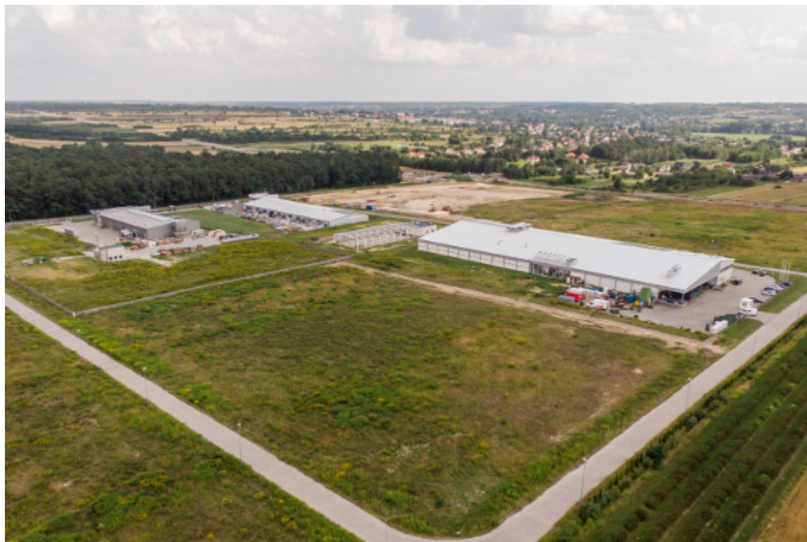
W ostatnich miesiącach Kraśnicka Strefa Inwestycji przeżywa intensywny rozwój.

W listopadzie atrakcyjne tereny inwestycyjne o łącznej powierzchni ponad 5 hektarów zaoferował na sprzedaż Urząd Miasta Kraśnik.