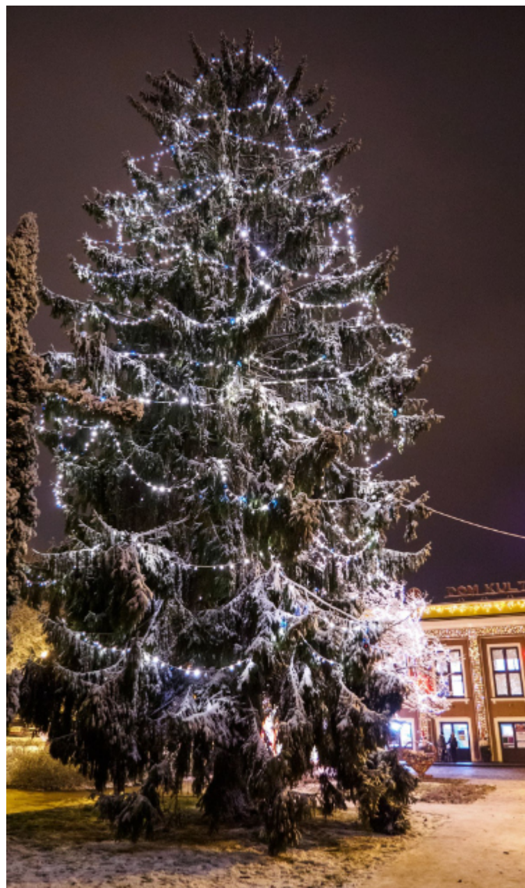
Iluminacje świąteczne przed CKiP