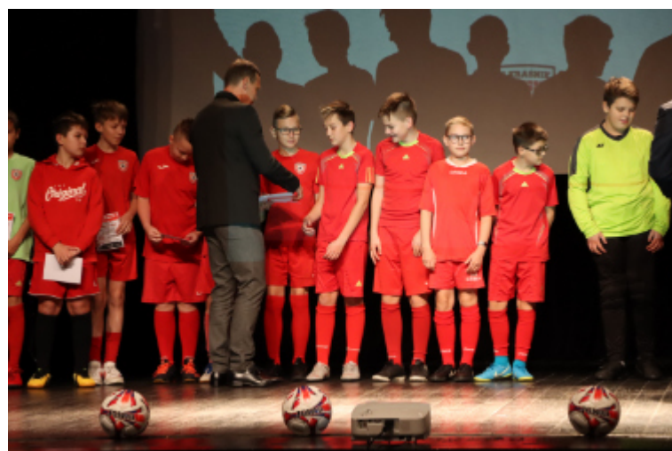
W MUKS trenuje obecnie blisko 200 dzieci i młodzieży.