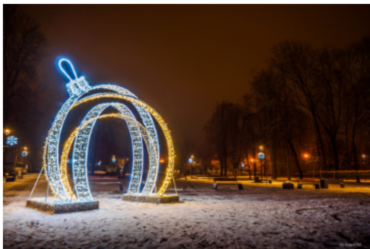
Iluminacje świąteczne w parku im. Jana Pawła II.