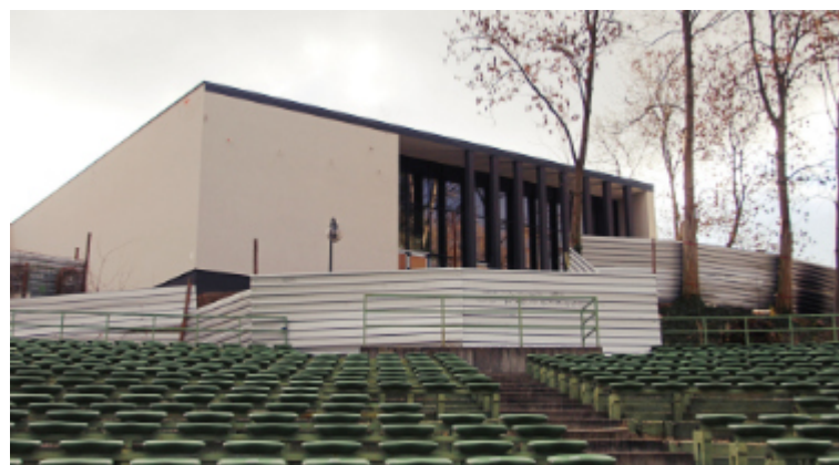
Integralną częścią inwestycji przy ul. Kościuszki jest nowoczesna oficyna, widoczna od strony amfiteatru.