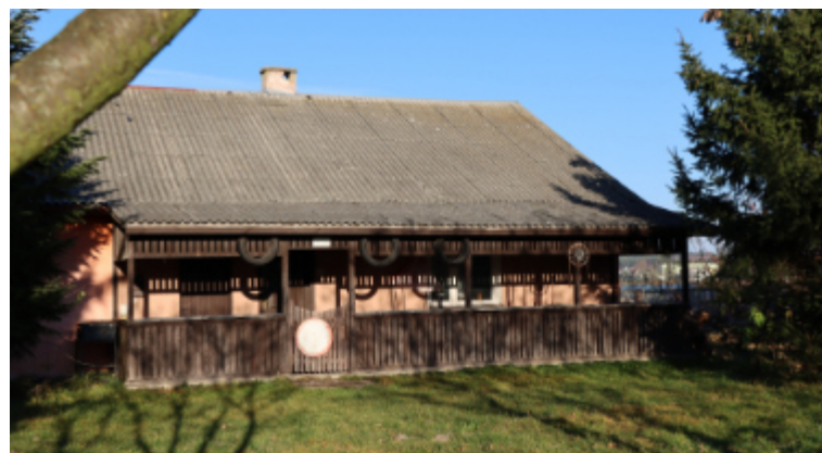
Stowarzyszenie „Tulimy” opiekę nad zwierzętami będzie prowadziło w budynku przy Zalewie Kraśnickim.

Zachęcamy do odwiedzania profilu Fb Stowa-