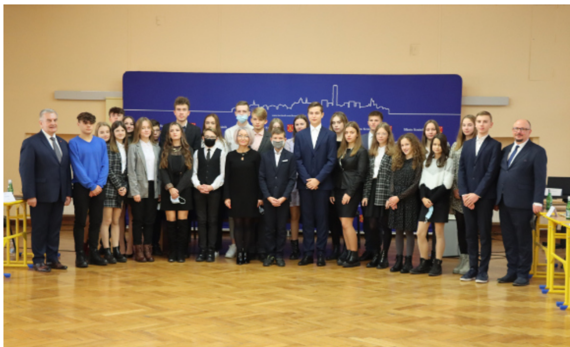
Młodzieżową Radę Miasta tworzy 26 uczniów kraśnickich szkół.