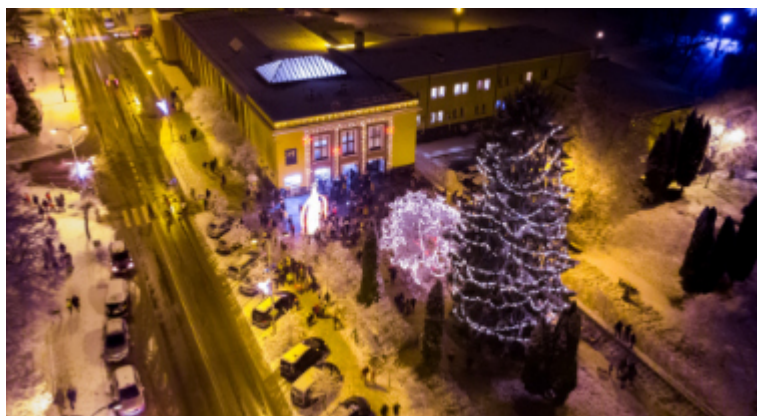
Iluminacje świąteczne przed CKiP