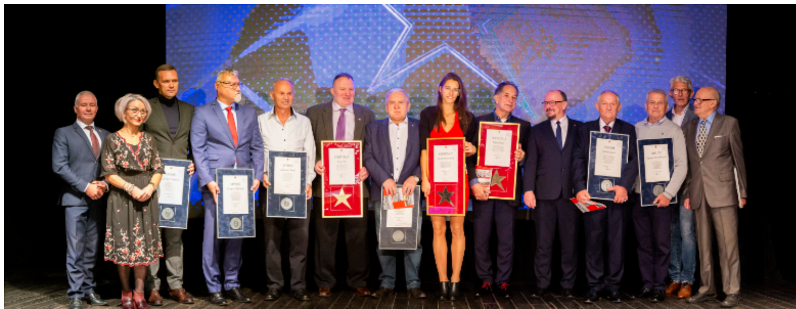
Wyróżnienia otrzymali także zasłużeni trenerzy i działacze.