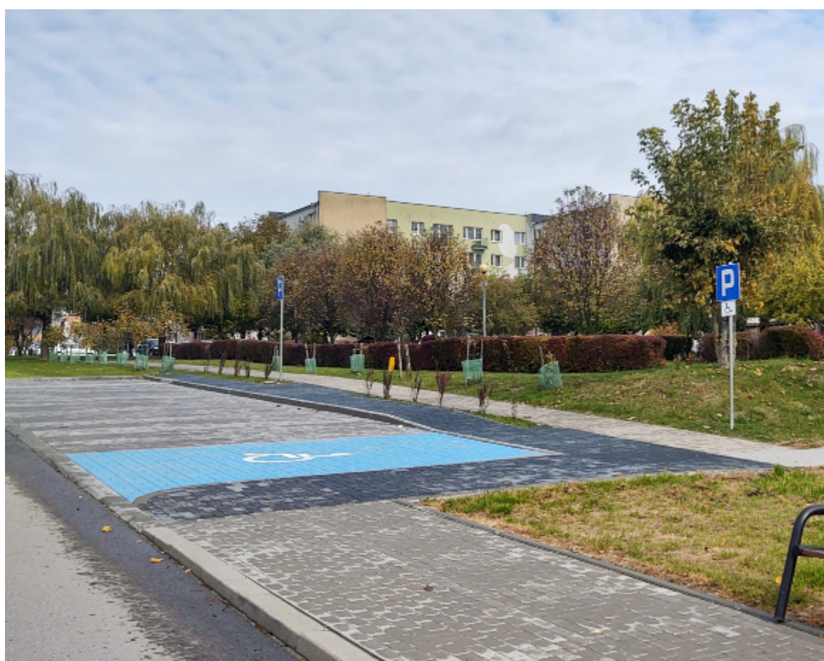
Jednym z projektów wybranych przez mieszkańców jest budowa nowych miejsc parkingowych przy ul. Wyszyńskiego.

Dzielnica VII: Oczyszczacze powietrza dla Przedszkola Miejskiego nr 6, Szkolny Kącik Relaksu w Szkole Podstawowej nr 4.