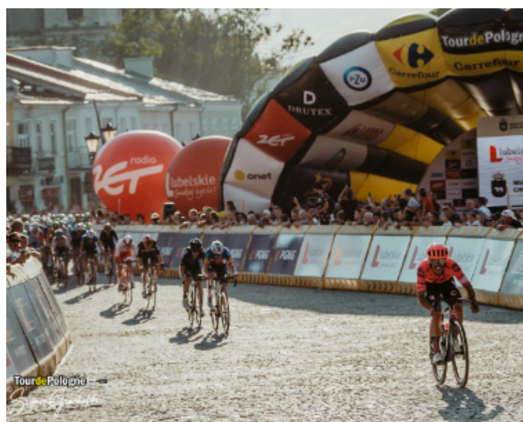
Z Kraśnika wystartuje 3. etap wyścigu.

Przygotowania do tego wydarzenia trwają już od dłuższego czasu, ale jak podkreślił na antenie TVP Sport organizator TdP Czesław Lang, wyjątkowo wcześniej ta trasa została zaprezentowana, bo już 8 miesięcy przed rozpoczęciem wyścigu. W organizację startu 3. etapu zaangażowane są Miasto Kraśnik i Powiat Kraśnicki.