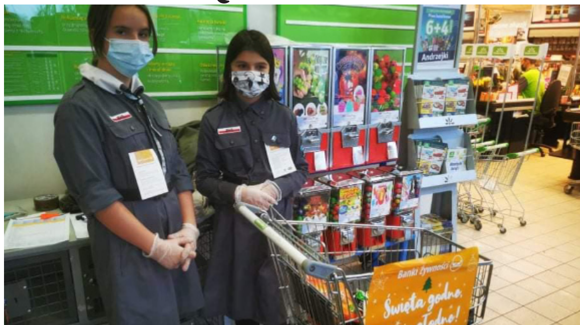
Ilość zebranej w tym roku żywności jest rekordowa.

Ilość zebranej w tym roku żywności jest rekordowa. Pozytywnie zaskakuje także liczba wolontariuszy zaangażowanych w akcję. Przy zbiórce, która odbyła się 26 i 27 listopada, pakowaniu zebranych darów i ich dystrybucji łącznie pracowało 110 osób. Byli to harcerze