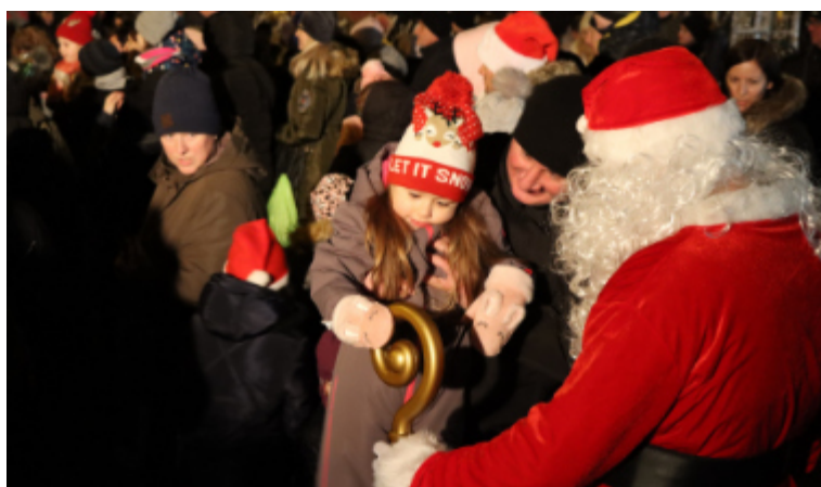
Spotkanie z Mikołajem w CKiP