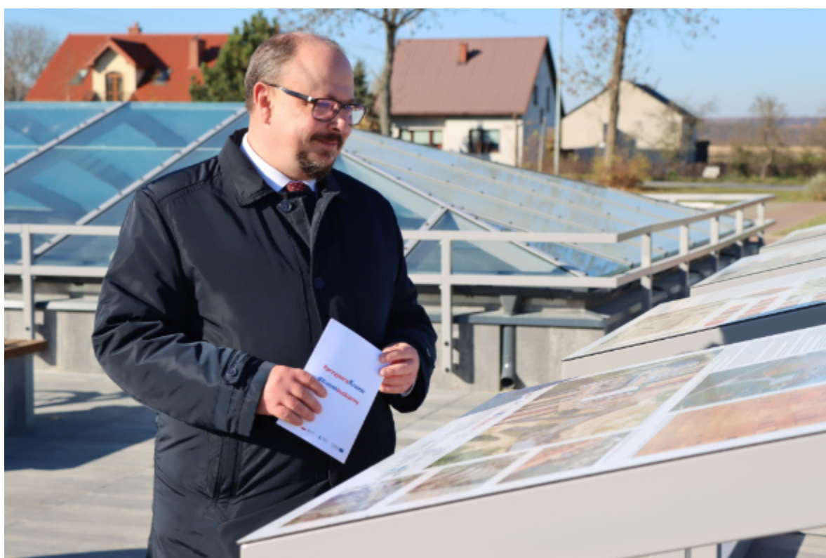
Odnowionej budowli towarzyszą tablice informacyjne dotyczące tego miejsca.