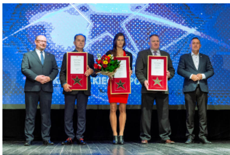
Kraśnicy olimpijczycy otrzymali pamiątkowe certyfikaty potwierdzające przyznanie gwiazd.