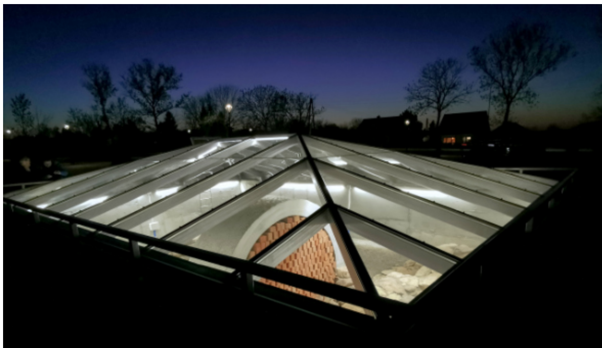
Odbudowany piec pięknie prezentuje się także nocą.