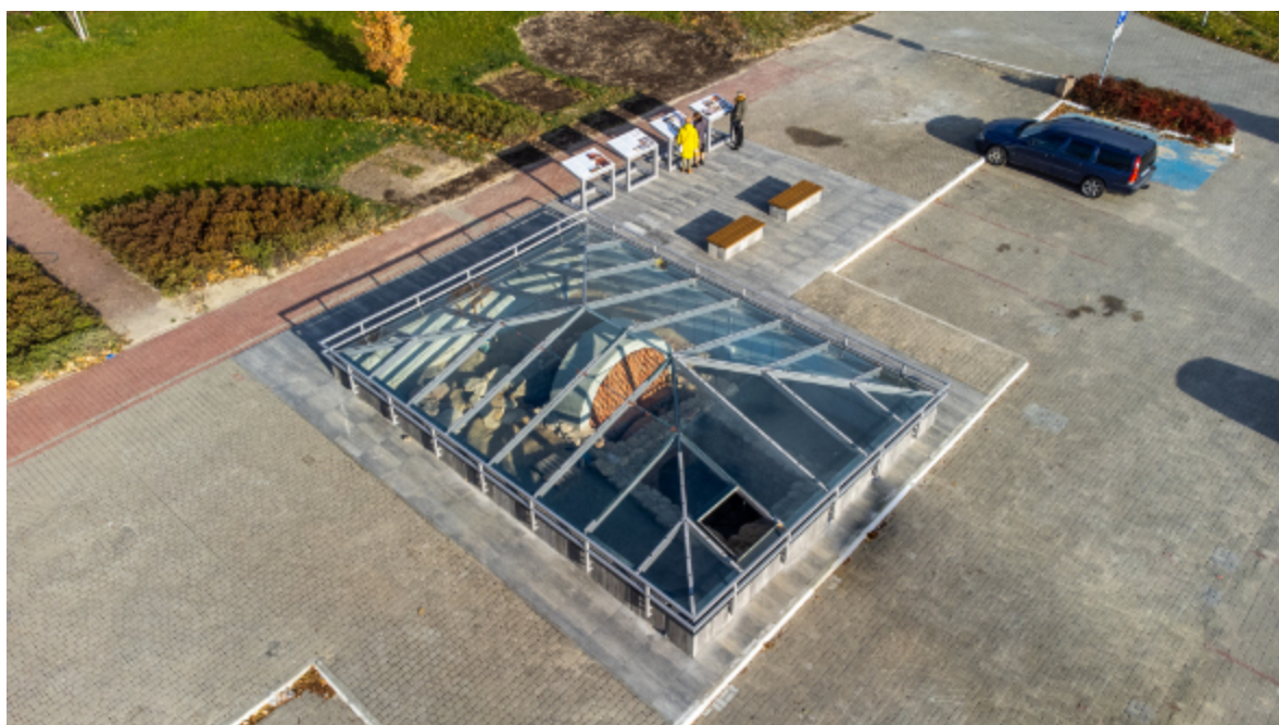
Na realizację tej inwestycji Miasto Kraśnik pozyskało środki z funduszy unijnych.