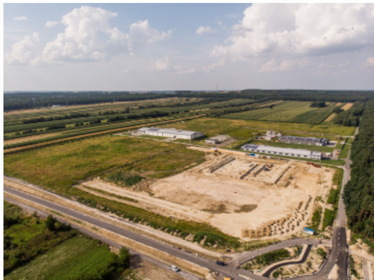
Działki przeznaczone są pod zabudowę produkcyjną lub magazynową.

W listopadzie atrakcyjne tereny inwestycyjne o łącznej powierzchni ponad 5 hektarów zaoferował na sprzedaż Urząd Miasta Kraśnik.