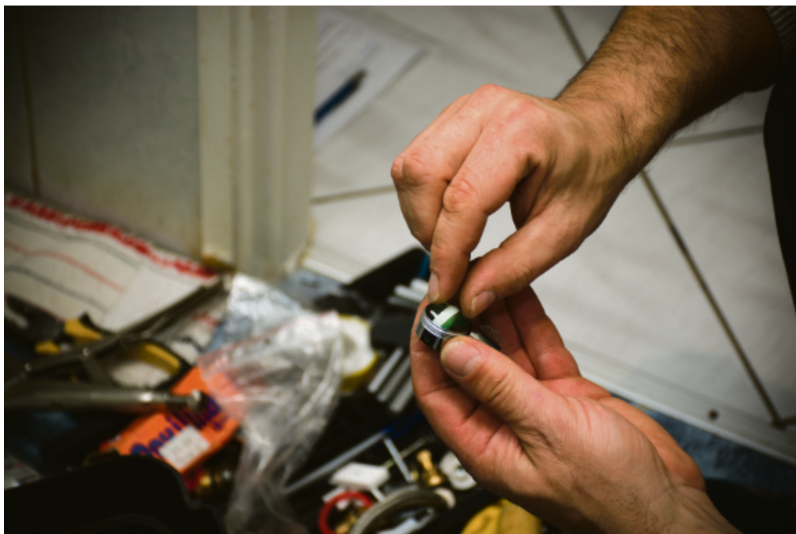
Do „Złotej Rączki” seniorzy najczęściej zgłaszają problemy z hydrauliką i elektryką.

Usługa jest darmowa pod warunkiem, że koszt zakupu potrzebnych do naprawy części nie przekroczy 30 złotych. Wydatki ponad tę sumę musi pokryć zamawiający, ale co ważne o zakup części martwi się osoba wykonująca naprawę. Zgłoszenia napraw przyjmowane są w godzinach 10:00 – 18:00 od poniedziałku do piątku pod nr tel. 724 708 148.