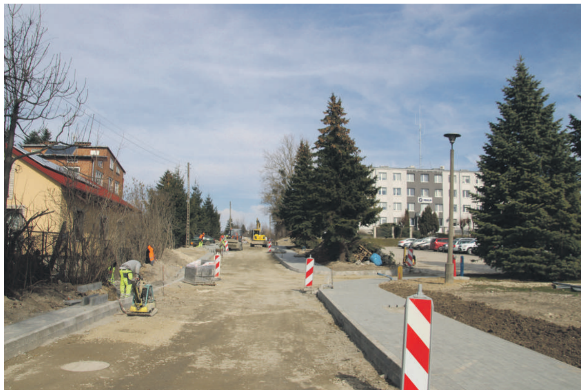
Ulica Ostrowiecka połączy Willową z Al. Tysiąclecia.