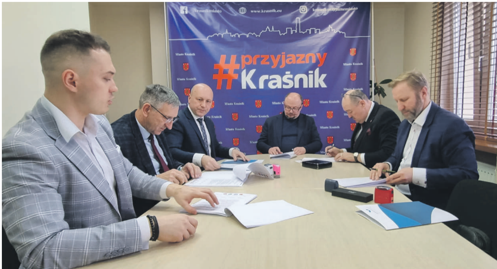
Do Klastra Energii będą mogli dołączyć także przedsiębiorcy i spółdzielnie mieszkaniowe.

Stanie się to możliwe dzięki zróżnicowaniu źródeł energii,