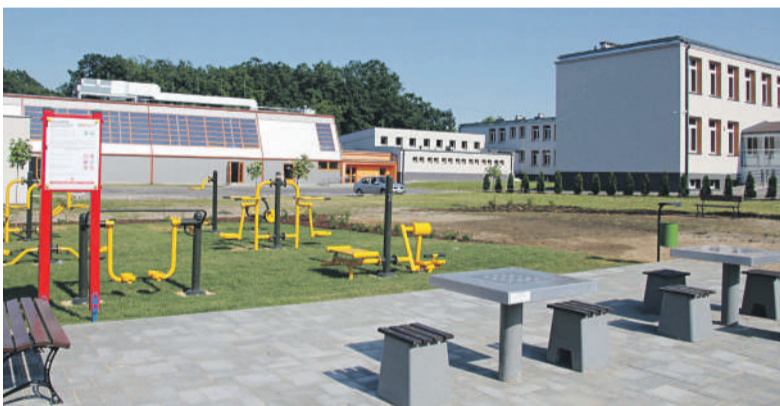
Siłownia i strefa relaksu przy SP nr 6.