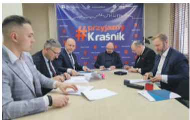
Powstał Kraśnicki Klaster Energii

Klaster umożliwi budowanie dużych farm fotowoltaicznych, magazynów energii oraz produkcję i obrót energią.