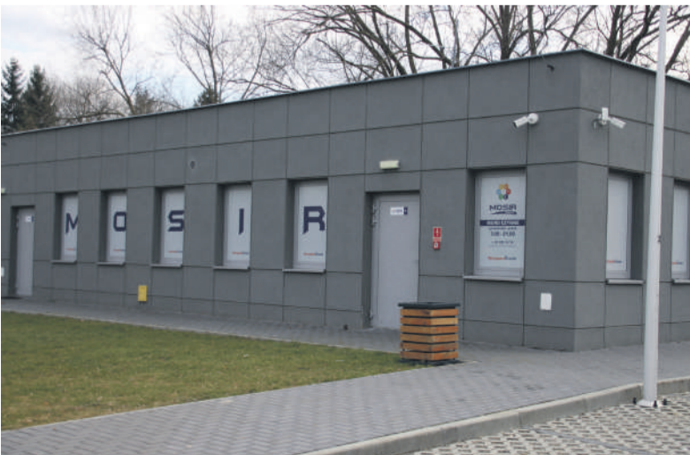
Zmodernizowane zaplecze LKS „Tęcza”.