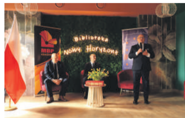
Nowe horyzonty przed MBP

Otwarcie siedziby głównej biblioteki miejskiej na ul. Koszarowej.