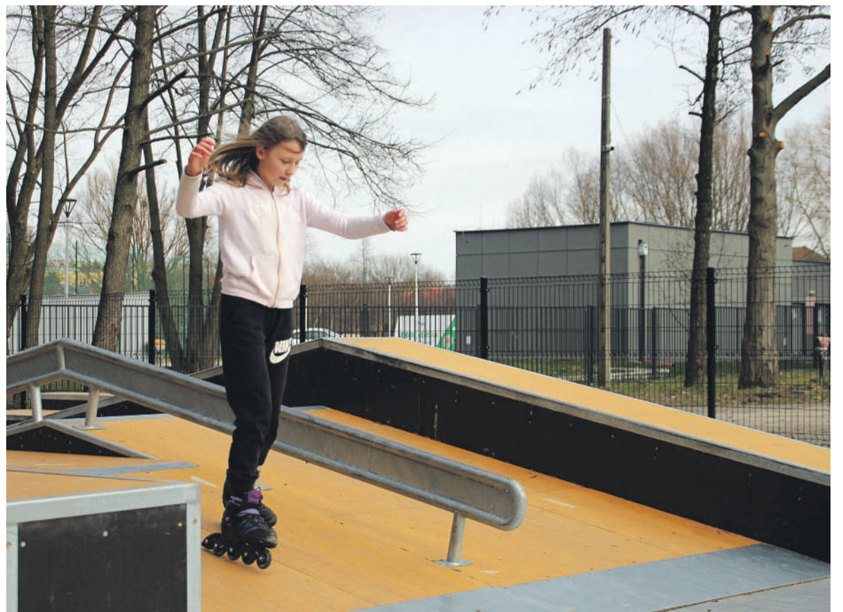
Skate park przy ul. Oboźnej.