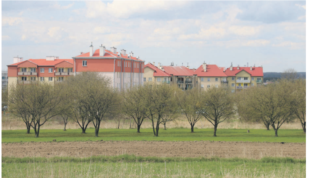
Nowe bloki mieszkalne powstaną na osiedlu Piaski.

Rynek mieszkaniowy w Kraśniku rozwija się. Chodzi zarówno o mieszkania czynszowe, jak i developerskie. Nasz samorząd jest w ten rozwój zaangażowany, chcemy bowiem wykorzystać atuty związane z położeniem miasta.