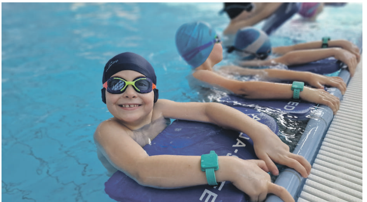
W pierwszej turze z lekcji nauki pływania skorzysta 235 dzieci.

SIM Lubelskie ma w Kraśniku zbudować 96 mieszkań o powierzchni 40 - 64 m kw. Wcześniej Miasto Kraśnik wniosło do spółki wkład własny w wysokości 3 mln zł. Są środki pozyskane z Rządowego Funduszu Rozwoju Mieszkalnictwa.