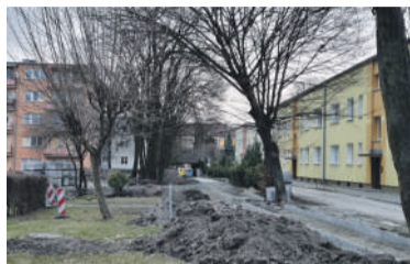
Nowy duży parking

Trwają prace przy ul. Kwiatkowskiego, gdzie powstanie 60 miejsc parkingowych.