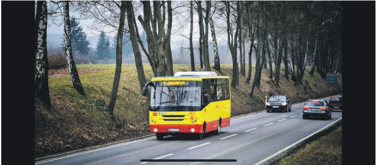
Operatorem większości połączeń będzie kraśnickie MPK.

Powiatowo-Gminny Związek Komunikacyjny Ziemi Kraśnickiej, założony przez Miasto Kraśnik w porozumieniu z Powiatem Kraśnickim, Miastem Urzędów i Gminami Kraśnik oraz Dzierzkowice, rozpoczął działalność. Na miejskie i pozamiejskie trasy wyruszyły autobusy w ramach kilkunastu linii obejmujących swoim zasięgiem teren wspomnianych samorządów.