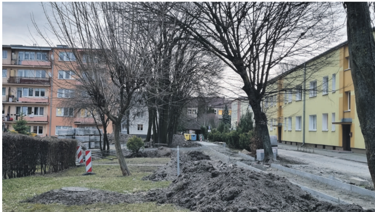
W tej okolicy powstanie 60 nowych miejsc parkingowych.

Dzięki poprzednim akcjom z naszej rzeki i jej okolic zebrano prawie 3,5 tony śmieci. Każda para rąk i każda pomoc jest ważna. Zachęcamy do udziału.