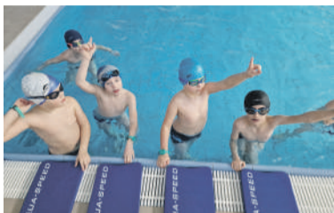
Bezpłatna nauka pływania

Ruszył projekt bezpłatnej nauki pływania dla uczniów klas pierwszych.