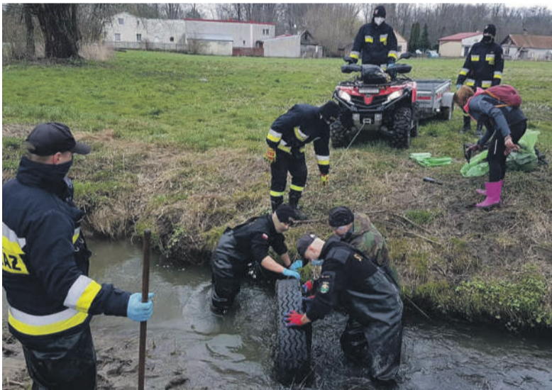
Dzięki poprzednim akcjom zebrano prawie 3,5 tony śmieci.