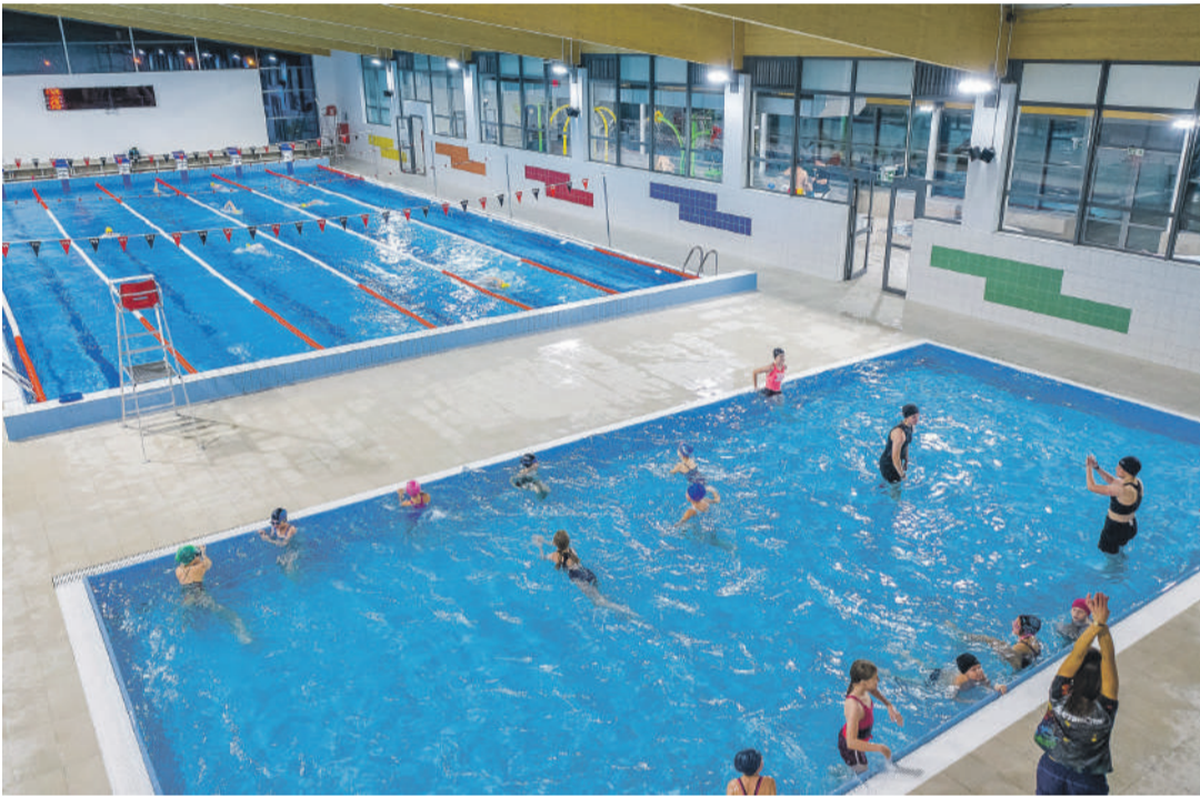
Nowa pływalnia MOSiR.