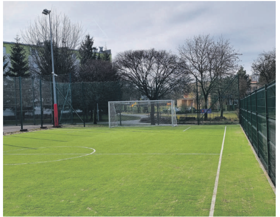
Boisko ze sztuczną nawierzchnią na osiedlu Koszary.