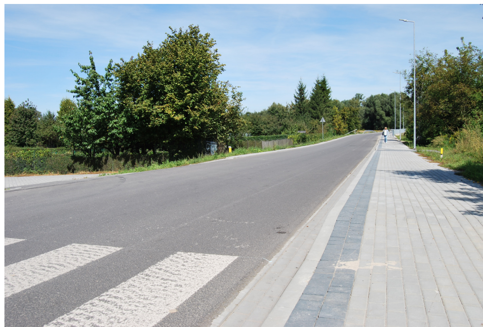
Łącznik ul. Jagiellońskiej i Suchyńskiej