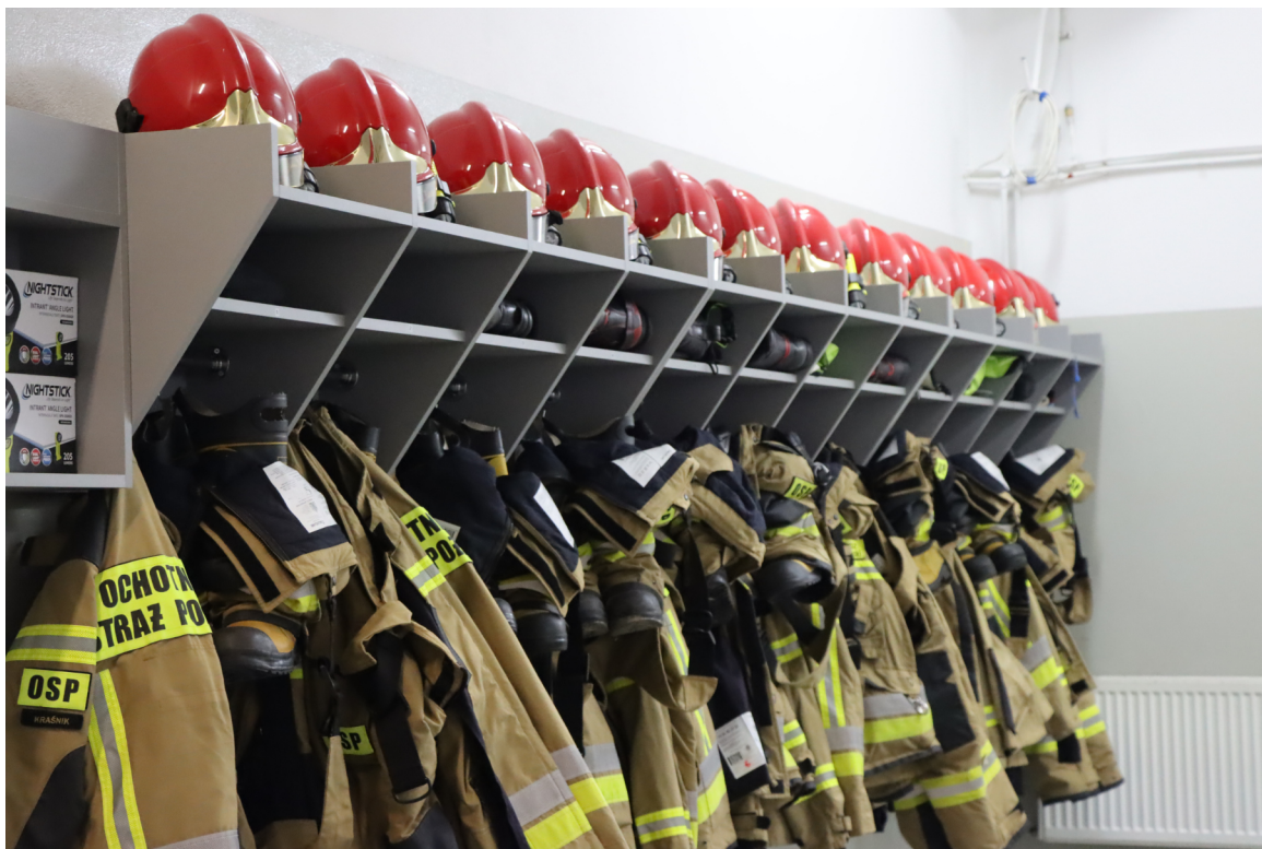
Z Budżetu Obywatelskiego sfinansowano zakup strojów dla Miejskiej OSP.