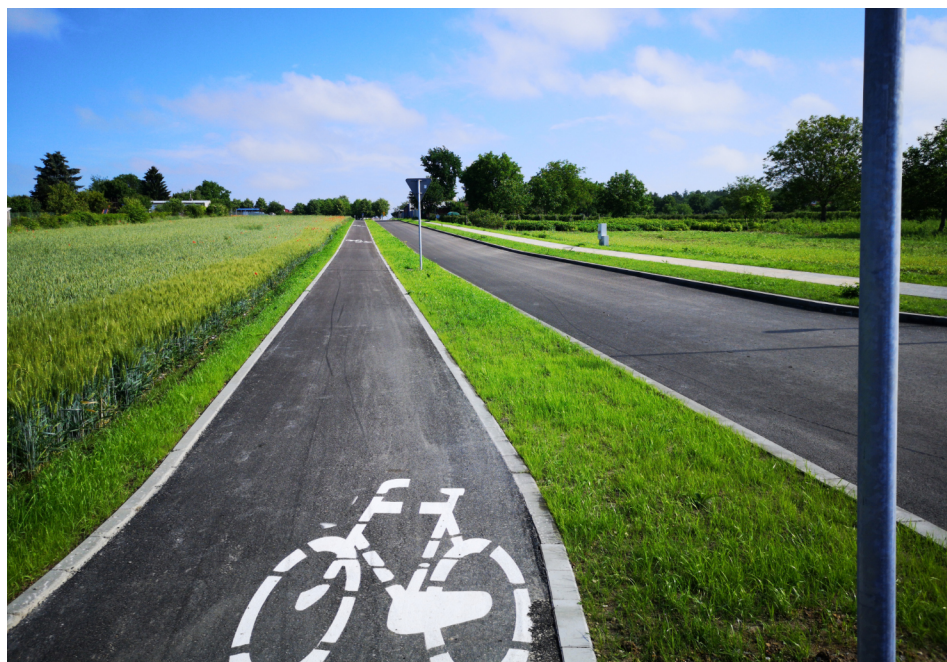
Łącznik Al. Młodości i ul. Granicznej