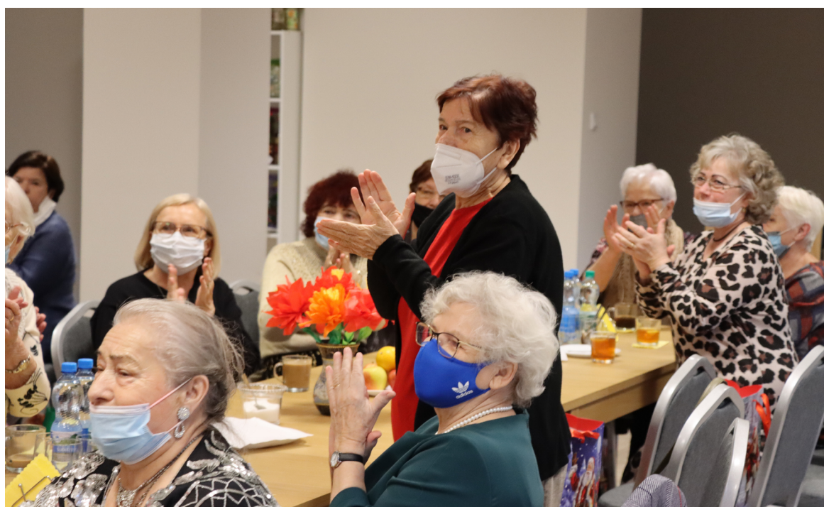
Klub Senior + działa na ul. Sikorskiego 22.

Miasto Kraśnik otrzymało dotację na utworzenie Klubu Senior +.