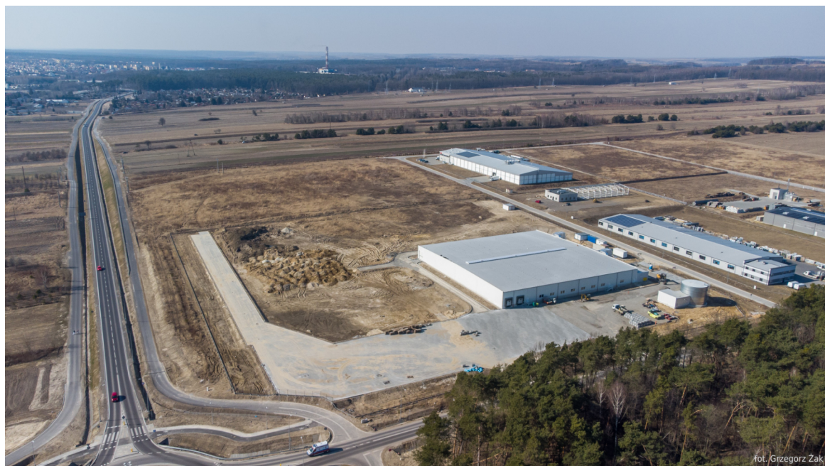
W kraśnickiej strefie ekonomicznej pojawiają się kolejni inwestorzy.

W Kraśniku powstanie nowoczesny zakład, w którym będą wytwarzane kielki oraz owoce i warzywa liofilizowane.