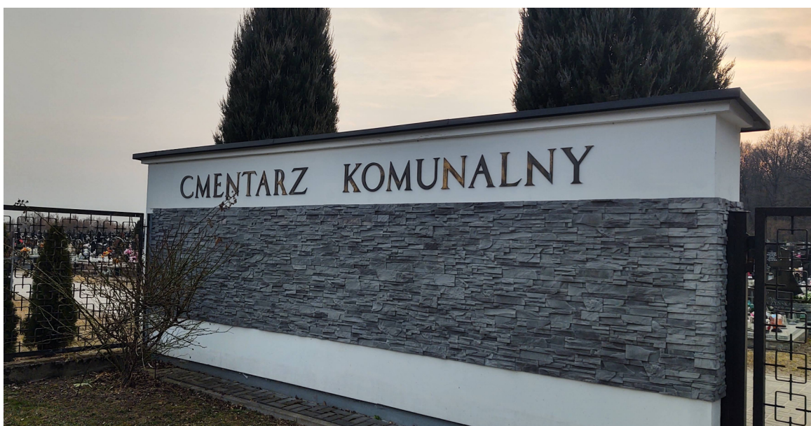
Kolumbarium zostanie zbudowane na cmentarzu komunalnym.

Jeśli zainteresowanie tą formą pochówku okaże się duże, możliwa będzie szybka budowa kolejnego kolumbarium w innej części tej nekropoli, bliżej lasu.