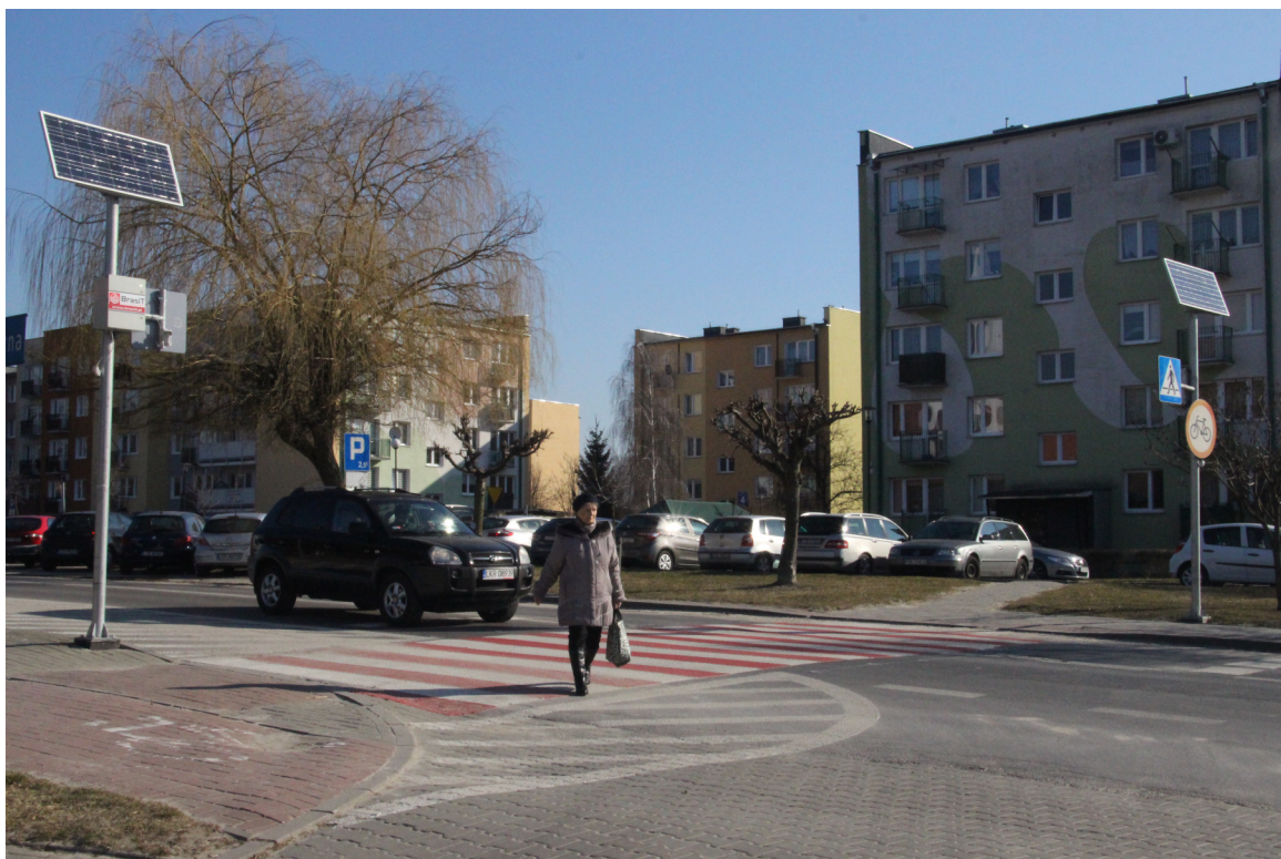
Na zdjęciu bezpieczne przejście na ul. Kard. Wyszyńskiego.