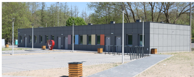
Stadion na ul. Obożnej to ważny ośrodek sportu w dzielnicy starej.

Obiekt został już przekazany użytkownikom w 2021 r. To ważne miejsce na sportowej mapie starej dzielnicy miasta.