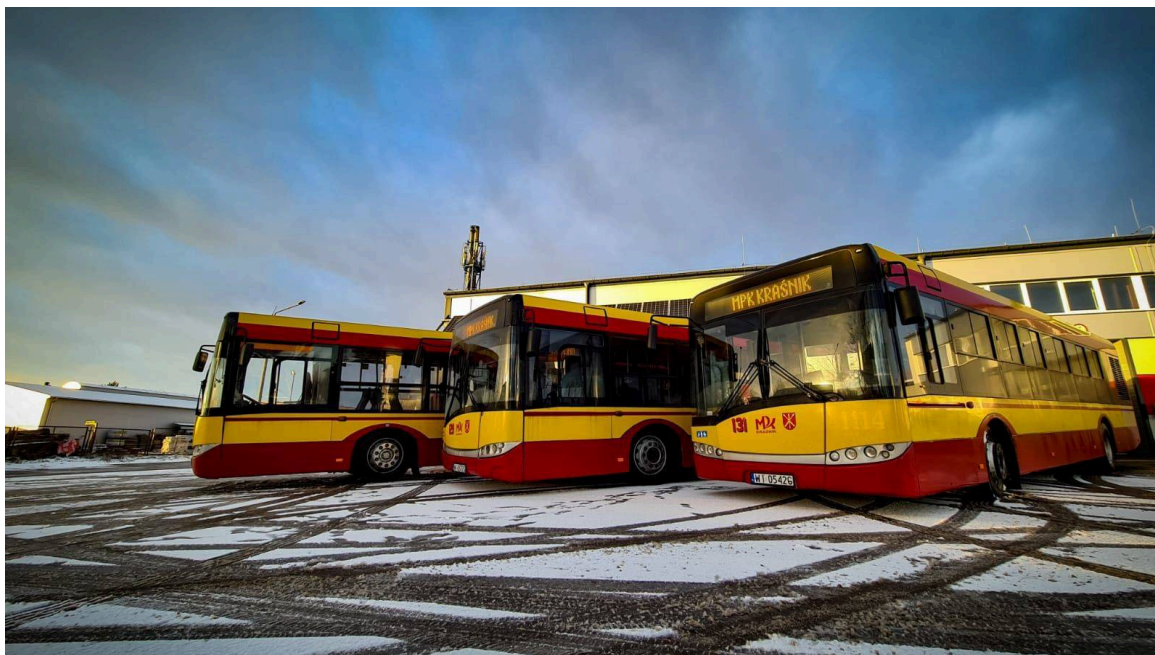
Ze środków Budżetu Obywatelskiego zakupiono trzy używane autobusy na potrzeby MPK.