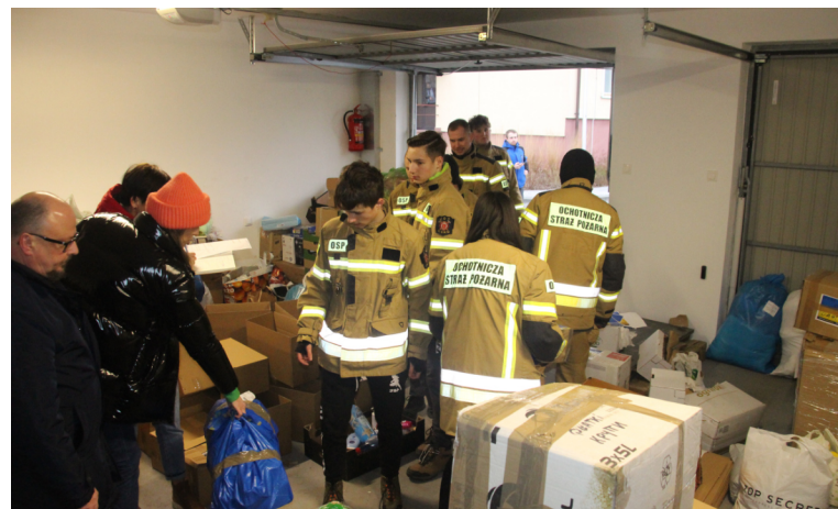
Transporty z pomocą humanitarną magistrat wysłał do Turjijska i Korostenia.

- 81 825 66 84 (Szkoła Podstawowa nr 5 – zapisy do szkół i przedszkoli)