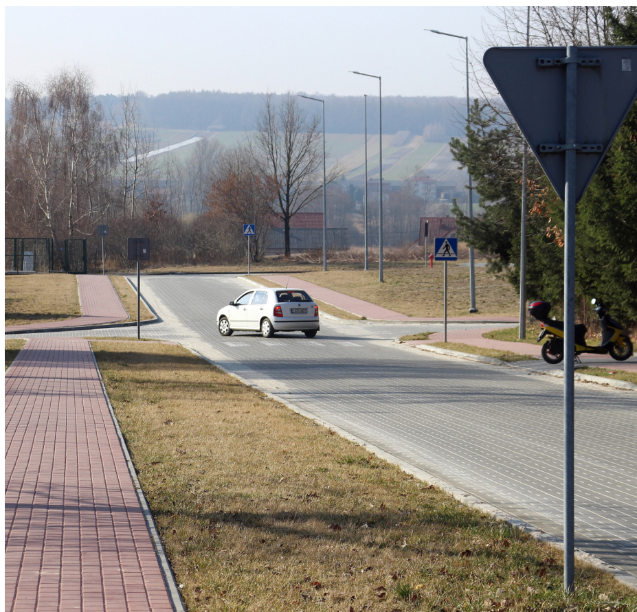
ul. Kard. Wyszyńskiego (do ul. Widok)