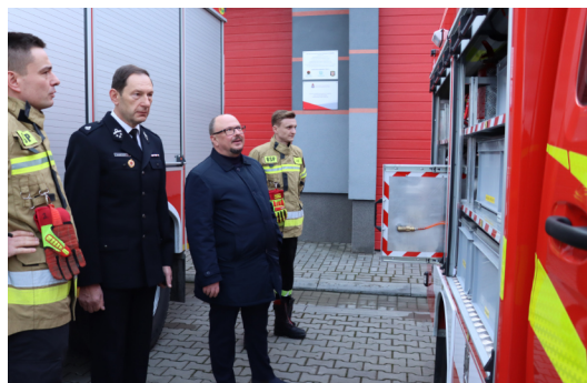
Miejska OSP ma coraz więcej nowoczesnego sprzętu, dlatego musi rozbudować swoją siedzibę.

Miejska Ochotnicza Straż Pożarna Krasnik będzie dysponować większą siedzibą, co pozwoli jej jeszcze lepiej realizować działania z zakresu bezpieczeństwa.