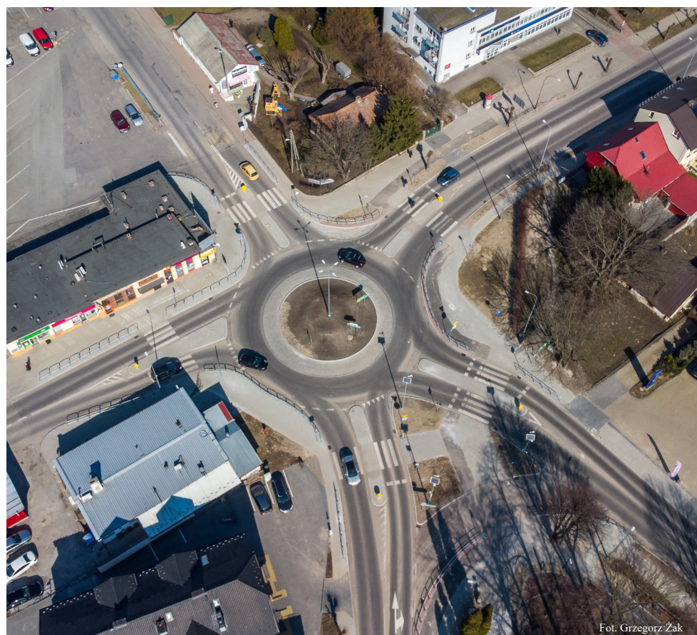
Rondo Żołnierzy Wyklętych