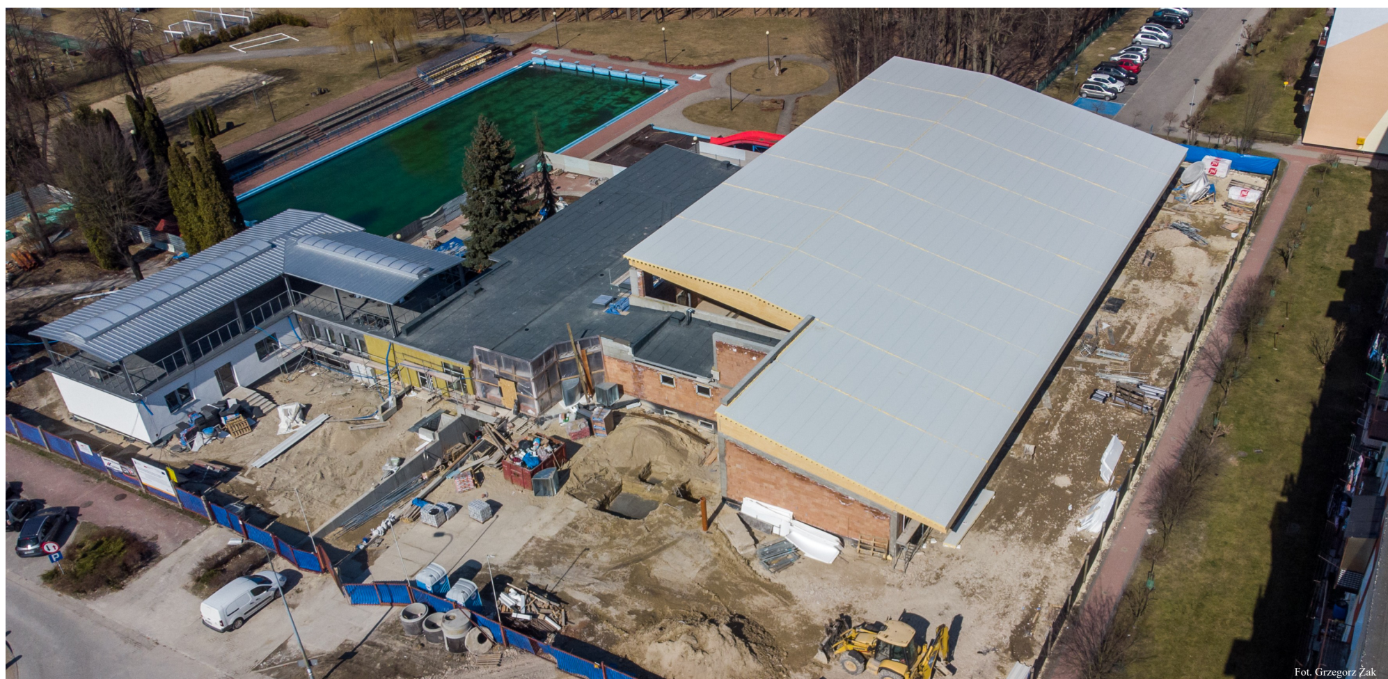
Fot. Grzegorz Żak