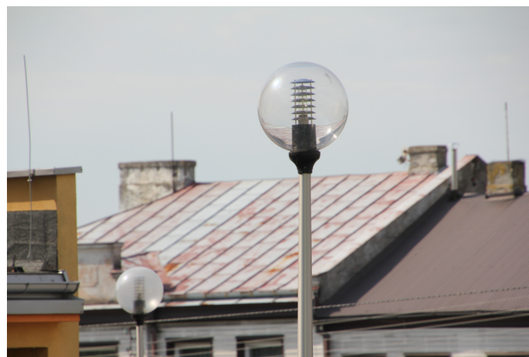
Każdego roku w mieście wymieniane są oprawy oświetleniowe na nowe energooszczędne.

Ma być jaśniej, a przy okazji oszczędniej. Aktualnie trwa drugi etap modernizacji oświetlenia ulicznego w Kraśniku.