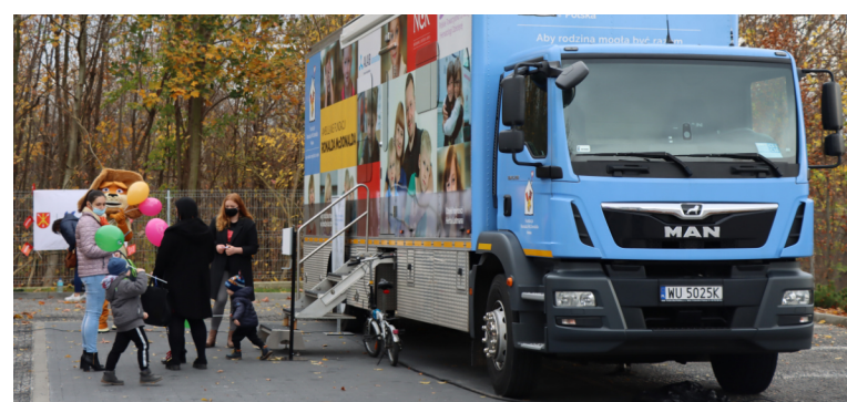
Ponad 100 dzieci zbadano w trakcie tej akcji profilaktycznej.