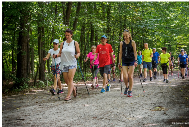
Zapraszamy na cykl imprez i treningów nordic walking.

Aby wziąć udział w wydarzeniu, należy zapisać się przez portal elektronicznezapisy.pl oraz dokonać wpłaty wpisowego na konto Fundacji: PNP Paribas 72 1750 0012 0000 0000 3615 9146 w tytule przelewu podając imię i nazwisko uczestnika oraz miejscowość rajdu. Mieszkańcy Kraśnika przez cały okres zapisów elektronicznych płać 20 zł (w dniu imprezy 50 zł).