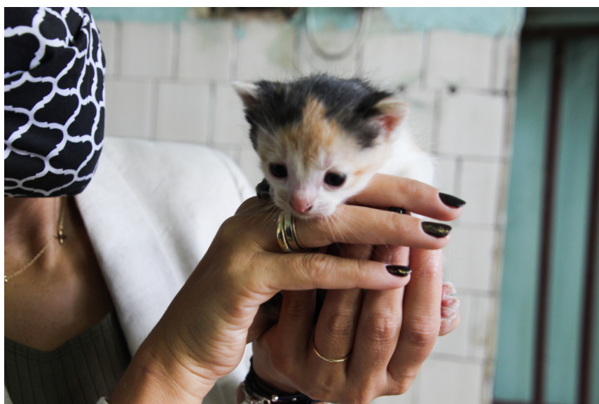
Bezdomnymi zwierzętami opiekują się wolontariuszki przy wsparciu finansowym miasta.

Miasto wydało w ubiegłym roku 410 skierowań na kastrację i sterylizację zwierząt właścicielskich oraz wolno żyjących kotów.