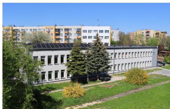
MBP doczeka się wreszcie nowoczesnej siedziby głównej.

Budynek Miejskiej Biblioteki Publicznej na ul. Koszarowej 10A powstał w 1977 r. i od tego czasu nie przechodził gruntownego remontu.