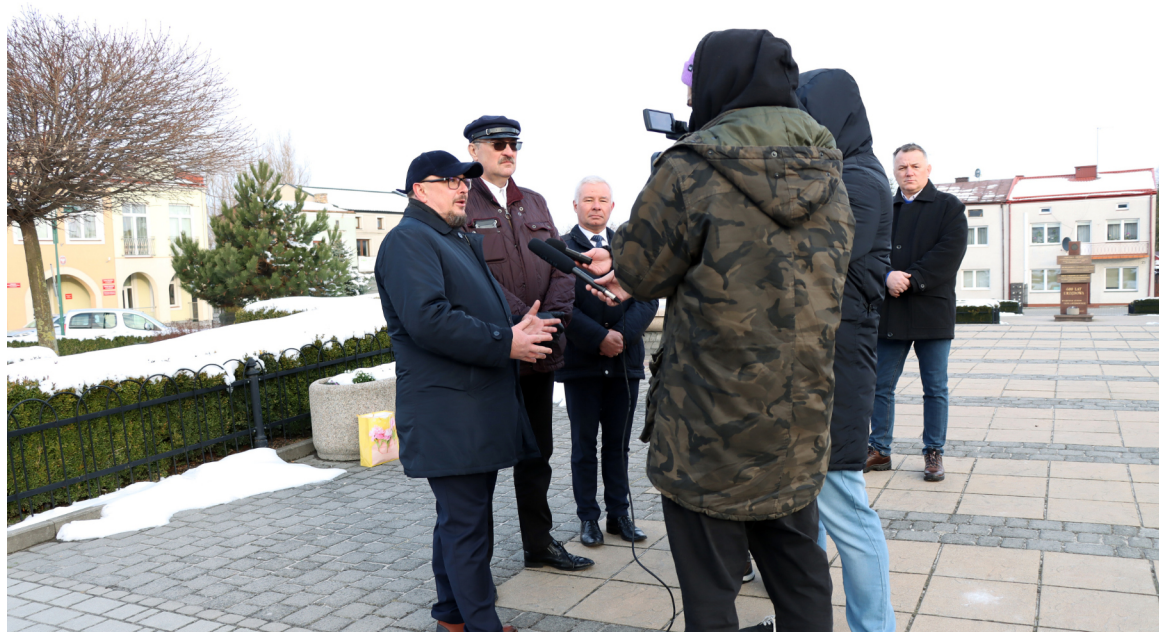
W inauguracji nowej linii uczestniczyli burmistrzowie Kraśnika i Urzędowa oraz starosta kraśnicki.

Docelowo w Kraśniku ma powstać od 150 do 200 lokali mieszkalnych.