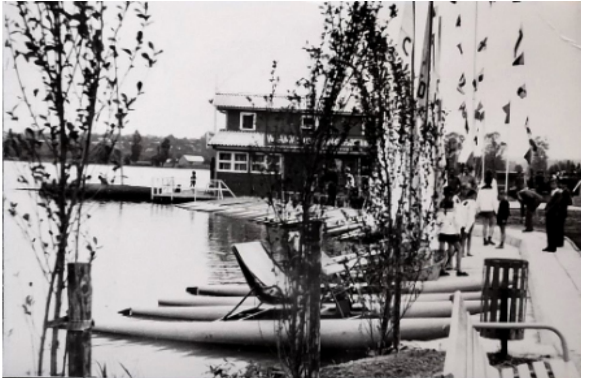
Pierwsze żeglarskie szlify harcerze zdobywali na Krzywiu.

W artykule pt. „Wyczyn”, opublikowanym w Harcerskim Tygodniku Ilustrowanym „Na przelaj” 7 czerwca 1964 r., nawiązano do sukcesu kraśnickich wodniaków. Bo tak należało ocenić posiadanie nietanich