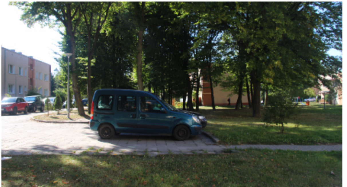
Duży parking powstanie na ul. Kwiatkowskiego.