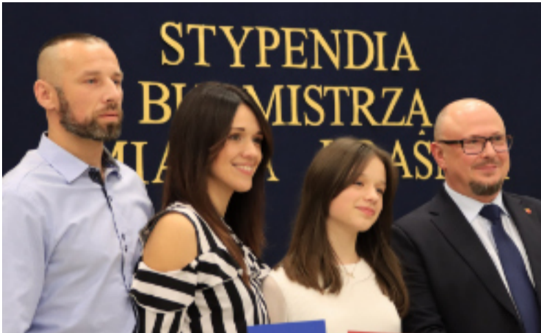
Wręczenie stypendiów odbyło się w Szkole Muzycznej i na Kościuszki 26.