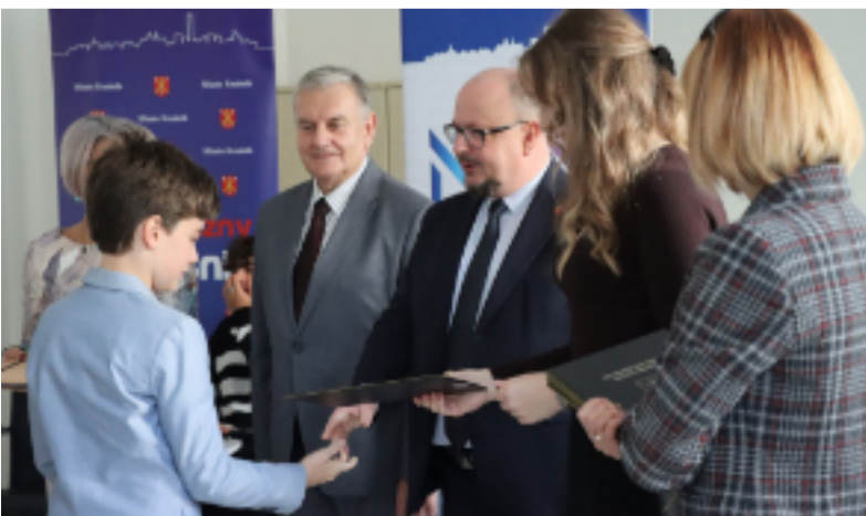
Skład Młodzieżowej Rady uzupełniony.