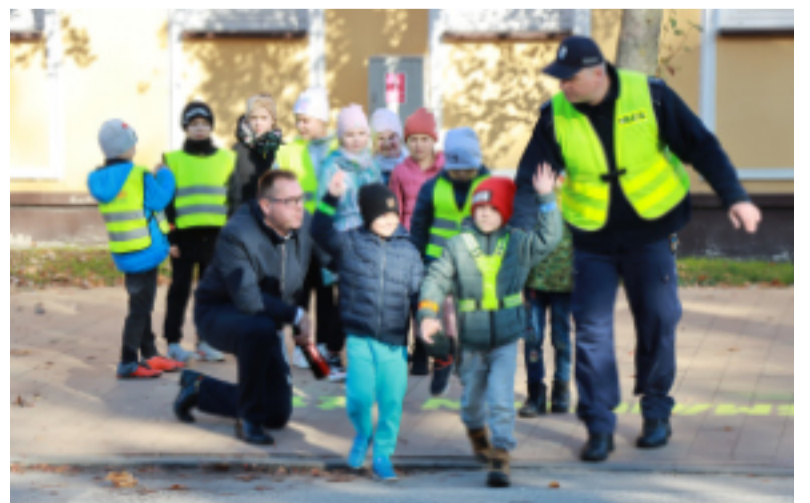
O bezpieczną drogę do szkoły dba Stowarzyszenie Rozwój i Bezpieczeństwo.