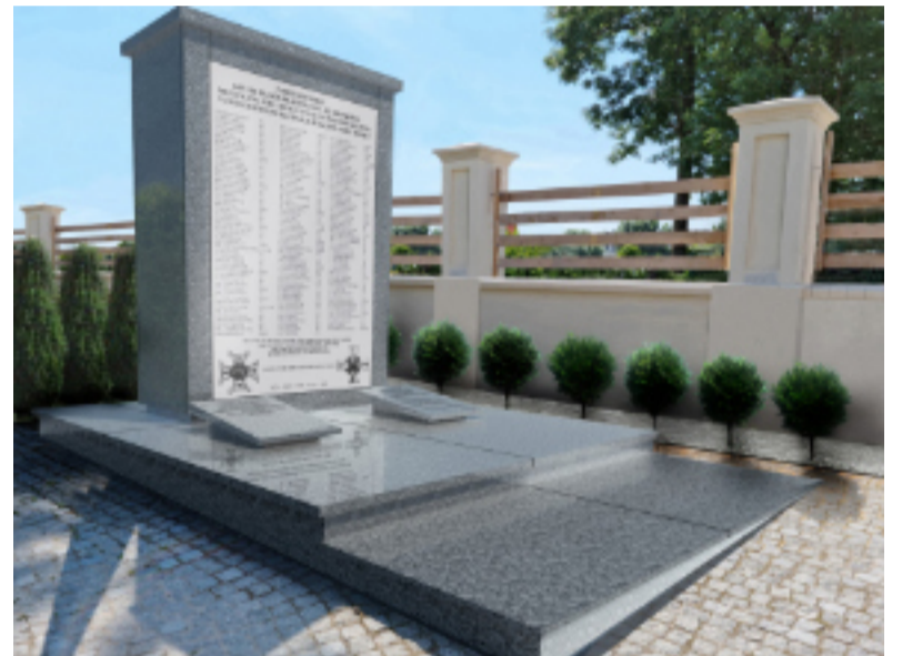
Wizualizacja nowego projektu.

Stąd decyzja o renowacji pomnika kraśnickich ułanów znajdującego się na terenie kościoła pw. WNMP. Środki na ten cel pochodzą z budżetu miasta i wynoszą 119 tys. zł. Obecny pomnik powstał w latach 60. i jego stan z biegiem czasu pogarszał się. To miejsce,