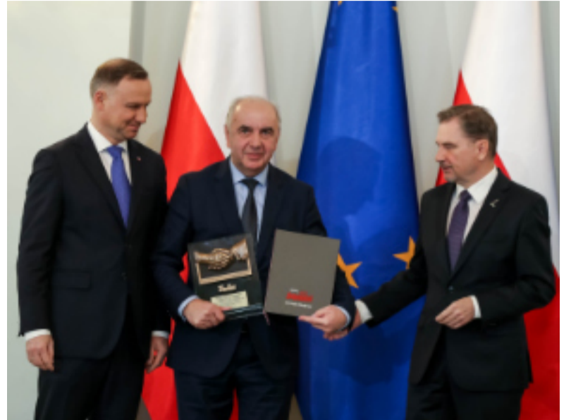
Wśród zakładów pracy wyróżnionych przez NSZZ „Solidarność” znalazła się kraśnicka spółka KPWiK.

Aktualnie w KPWiK jest zatrudnionych 109 osób.