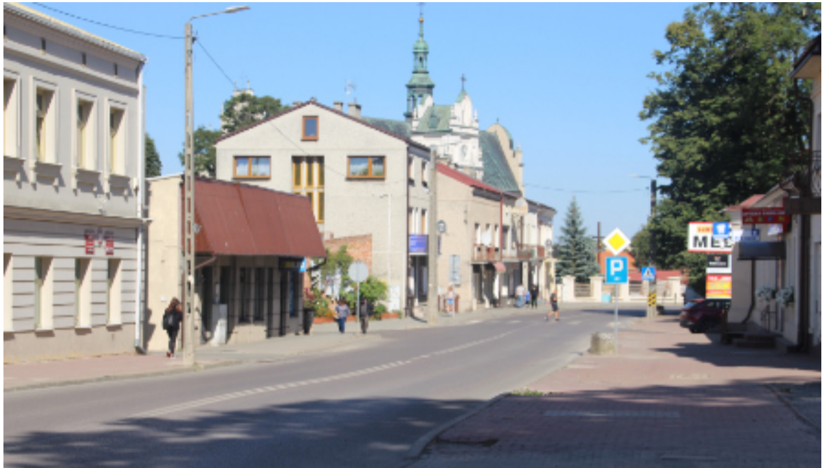
Nowe chodniki pojawiają się na ul. Kościuszki.