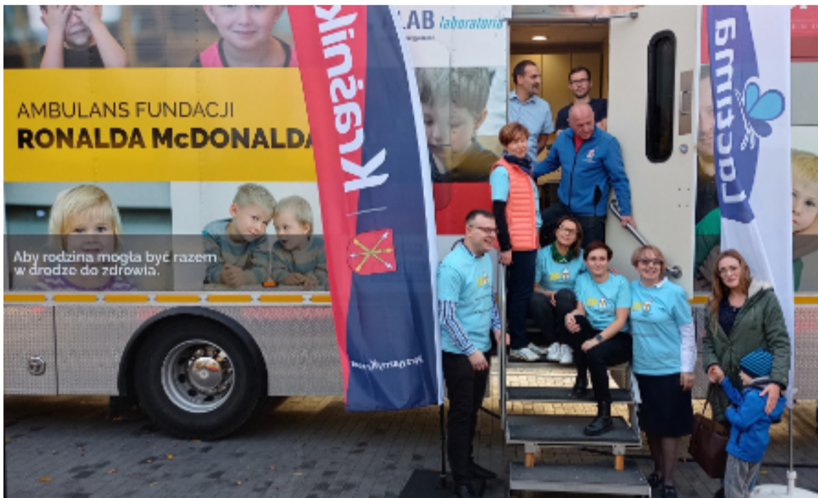
69 małych pacjentów przebadano w ambulansie.

w badaniu były baloniki, książeczki i słodycze. Badania dla małych pacjentów były bezpłatne. Ich koszty współfinansowały Miasto Kraśnik i firma Lactima. Nasz samorząd już zadeklarował chęć udziału w akcji w kolejnych latach.