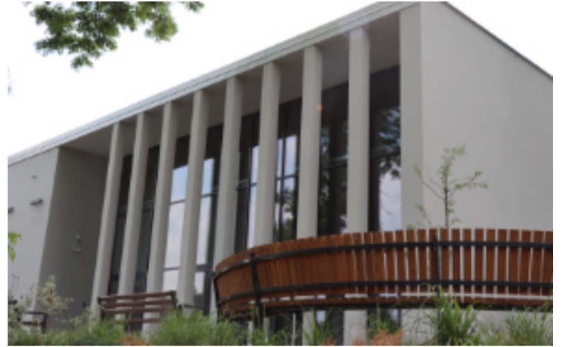
W ramach przebudowy powstała nowa oficyna z dużą salą konferencyjną.

W nowej części budynku znajduje się z kolei sala wielofunkcyjna pełniąca funkcję sali konferencyjnej, widowiskowej, sali do prowadzenia obrad sesji Rady Miasta, do prowadzenia zajęć sportowo-tanecznych, prób chórów, zespołów, orkiestr, spotkań integracyjnych. Pierwsze zajęcia w nowej placówce już wystartowały. Zapraszamy wszystkich chętnych do grup tanecznych, plastycznych i teatralnych, a także na zajęcia wokalne. Do zwiedzania indy-