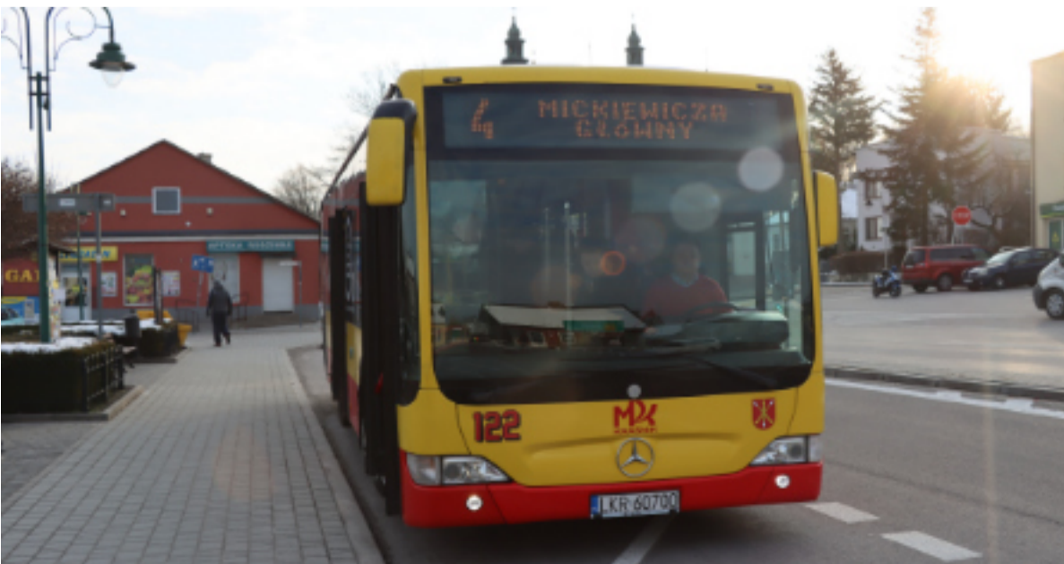
MPK będzie wozić mieszkańców powiatu.

Natomiast akcja „Odlóż smartfon i żyj” skierowana jest przede wszystkim do nieco starszych dzieci i młodzieży, ale i dorosłych. W jej ramach napisy ostrzegawcze tej właśnie treści pojawiły się na chodnikach przy szkołach oraz ruchliwych przejściach dla pieszych. Chodzi o przypomnienie, że korzystanie z telefonu podczas przechodzenia przez jezdnię jest nie tylko zabronione, ale przede wszystkim bardzo niebezpieczne.