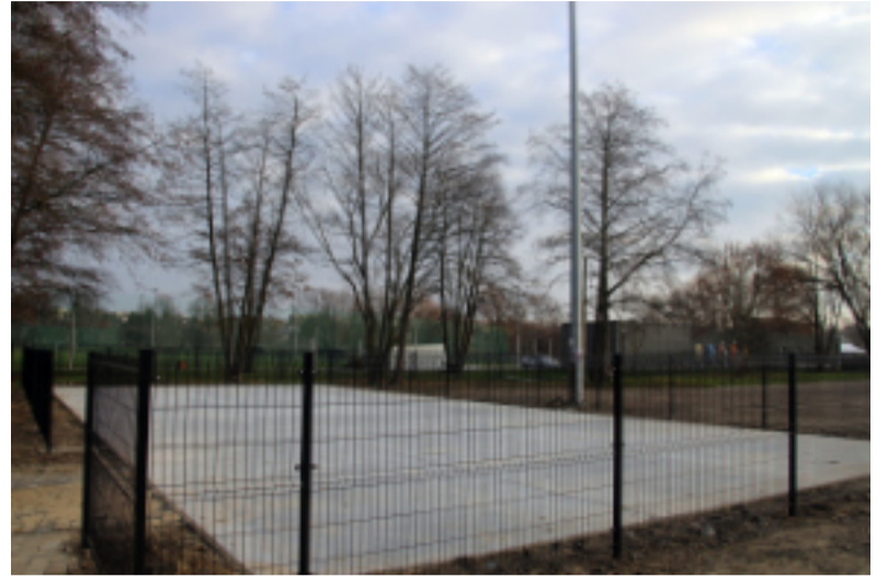
Nowy skate park będzie zlokalizowany na ul. Oboźnej.

Budowa skateparku kosztować ma 458 tys. zł, a modernizacja boiska - niespełna 270 tys. zł.