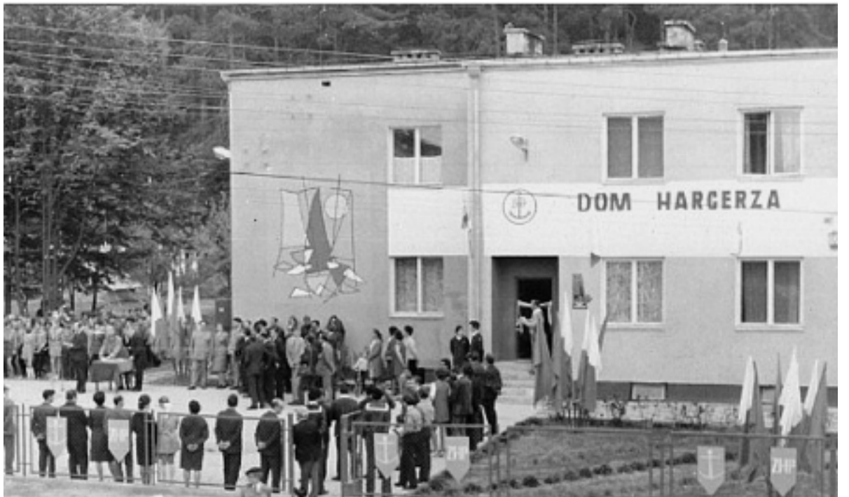
W latach 70. bezpieczną przystanią dla żeglarzy stała się harcówka na ul. Kwiatkowskiego.