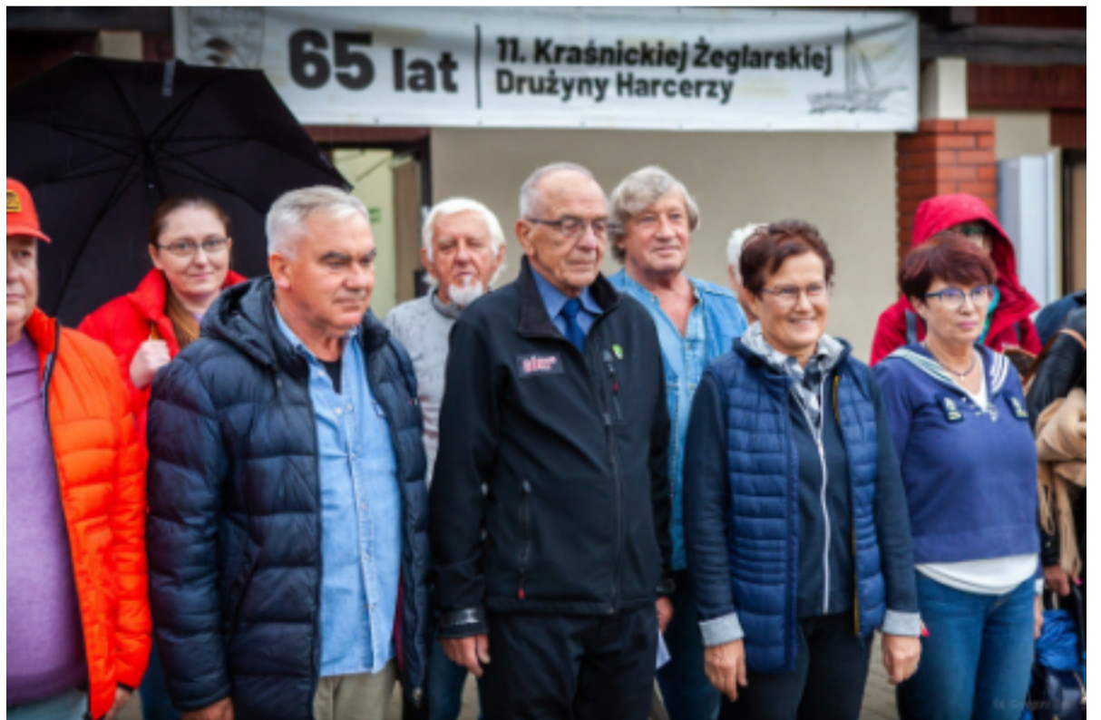
Członkowie 11. KZDH świętowali jubileusz w stacji nad Zalewem Kraśnickim.