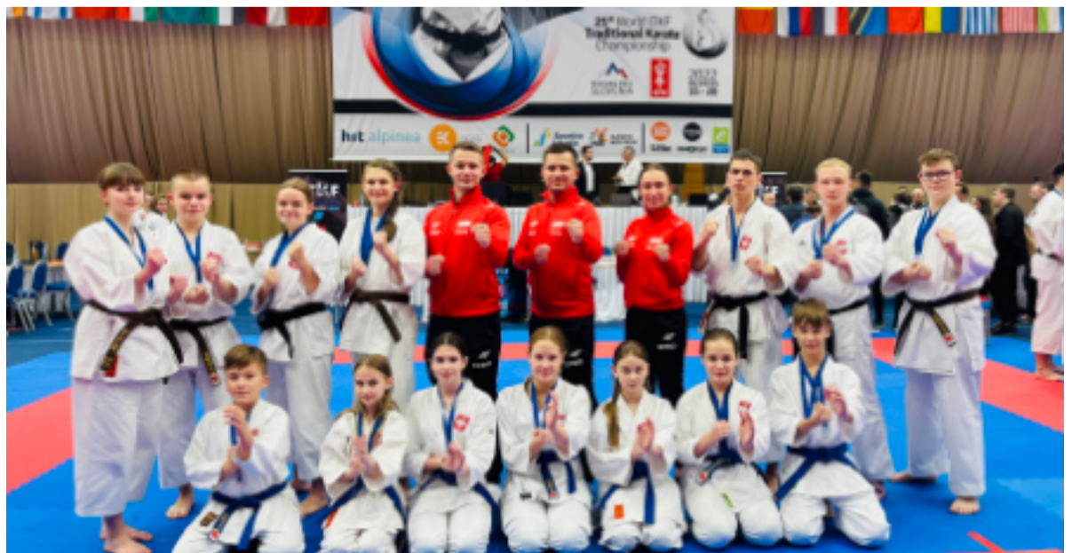
Sukcesy Chidori w Brazylii i Słowenii.