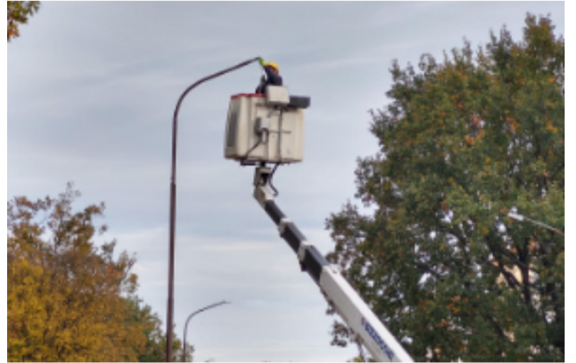
Nowe oprawy są energooszczędne.

inwestycję i budowę nowego oświetlenia na ul. Żytniej, to łącznie na poprawę jakości i energooszczędności oświetlenia ulicznego kraśnicki samorząd wyda w tym roku 3,6 mln zł. Co przy tym ważne, realizowany właśnie projekt jest współfinansowany ze środków Unii Europejskiej w ramach Regionalnego Programu Operacyjnego Województwa Lubelskiego na lata 2014-2020. Wartość dofinansowania wynosi 2,8 mln zł.