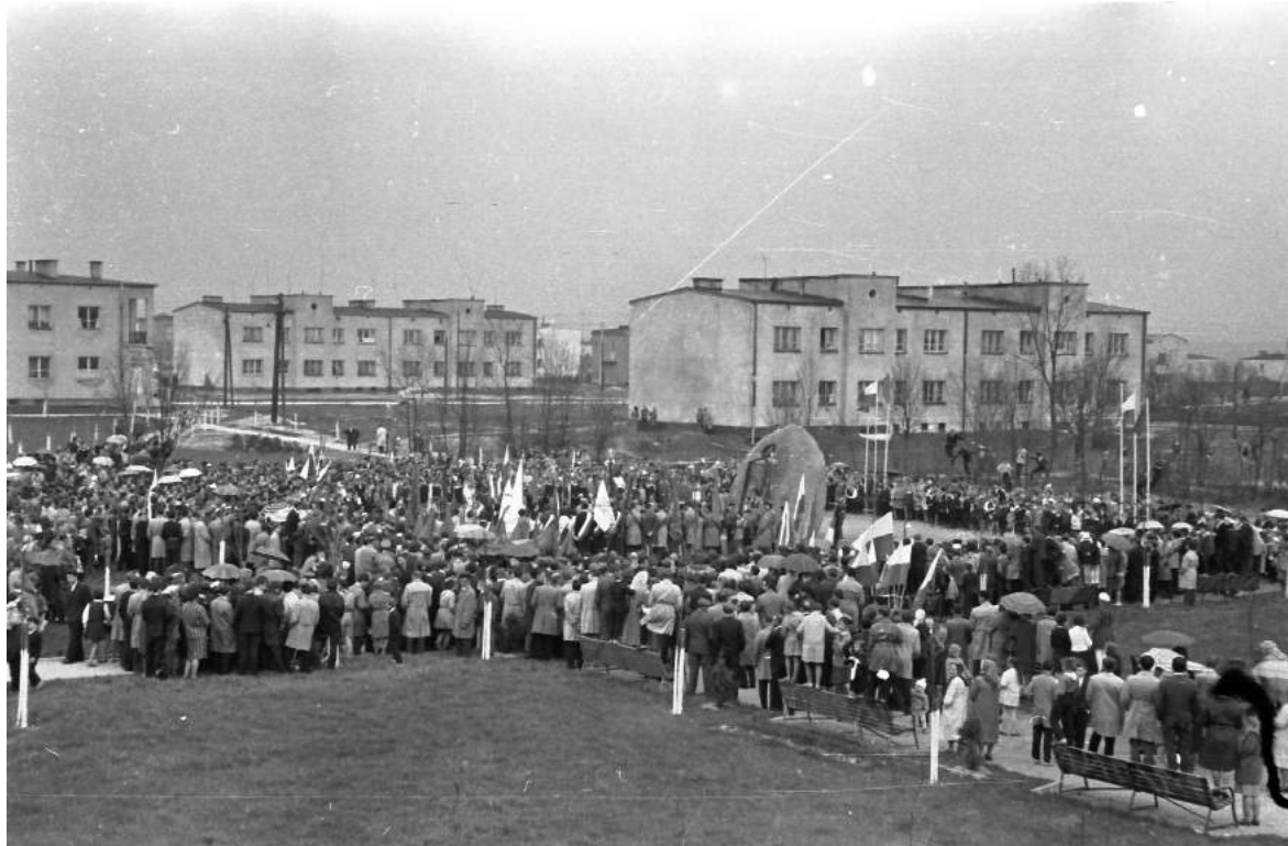
■ Na zdjęciu odsłonięcie pomnika w 1964 roku.