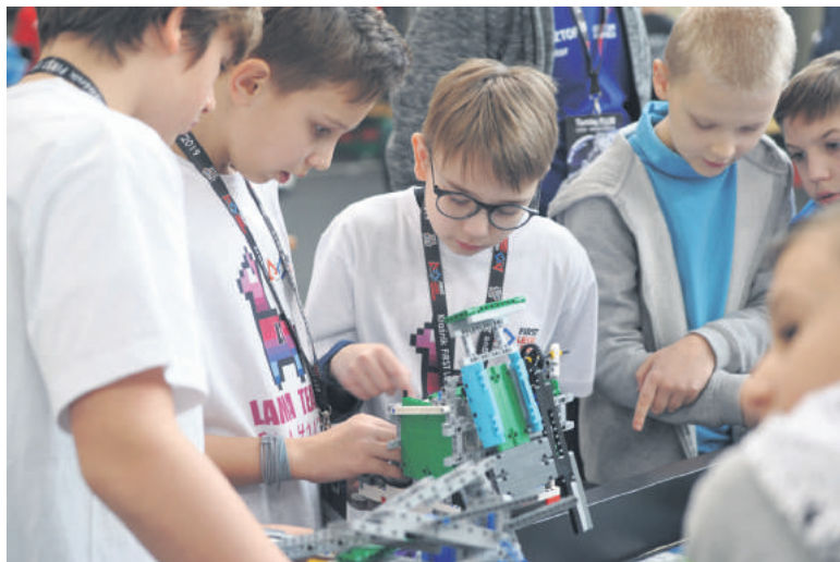
■ Zawody młodych twórców robotów wsparło Miasto Kraśnik.

12 stycznia, członkowie 16 drużyn złożonych z uczniów szkół podstawowych, wzięli udział w konkursie robotycznym FIRST LEGO League. Turniej współorganizowali ich starsi koledzy z drużyny Spice Gears Team z Zespołu Szkół Nr 3 w Kraśniku. To właśnie w tej szkole odbył się konkurs. Drużyny miały za zadanie wybudować wcześniej robota zdolnego funkcjonować w przestrzeni kosmicznej. Uczestnicy konkurowali