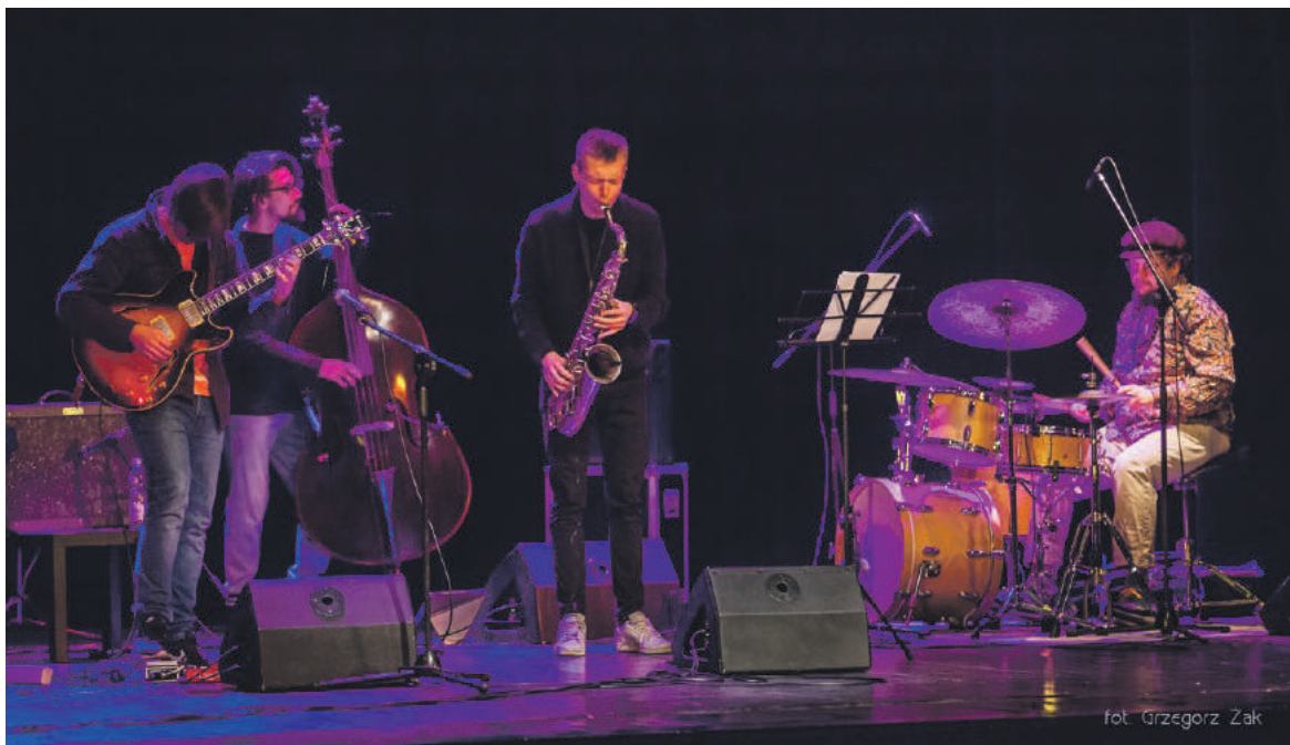
■ Polski jazz w ubiegłym roku rozbrzmiewał w murach CKiP wielokrotnie.

Centrum Kultury i Promocji od 7 listopada ubiegłego roku szczyli się go-dłem „Jazzowego Domu Kultury”, przyznawanym instytucjom promującym twórczość rodzimych muzyków jazzowych. Kraśnicki przybytek kultury wpi-sał się w to grono z chw-ilą przystąpienia do pro-gramu Polski Jazz 360°. Ten unikatowy, edukacyj-no – koncertowy program, firmowany przez Funda-cję Polski Jazz i dofinanso-wany przez Ministerstwo Kultury i Dziedzictwa Na-rodowego, ma na celu oba-lenie stereotypu, że jazz to muzyka niszowa, trudna w odbiorze i nieprzystępna. Autorzy programu czynią to za pośrednictwem in-stitucji kultury takich jak CKiP, zapraszając publiczność do uczestnictwa w wy-darzeniach artystycznych najwyższej próby i przybli-żając odbiorcom to, co ak-tualne w polskiej muzyce jazzowej, cieszącej się uzna-niem i szacunkiem na mię-dzynarodowej arenie. Swoją twórczość, bardzo różno-rodną pod względem sty-listyki, prezentują artyści nagradzani na festiwalach i konkursach jazzowych oraz gwiazdy światowe-go formatu. Reprezentu-jąc przeróżne nurty i tren-dy, pokazują oni cały prze-