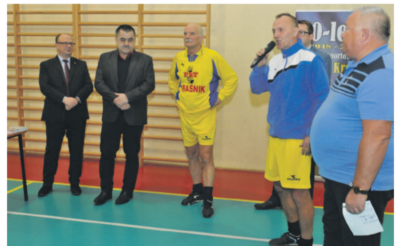
■ Imprezę zorganizowali dawni piłkarze Stali wspierani m.in. przez władze miasta.

Emocji nie brakowało. Zagrano systemem każdy z każdym. Bezkonkurencyjna i „mało gościnna” okazała się tego dnia ekipa gospodarzy. Stal I Kraśnik zgromadziła największą