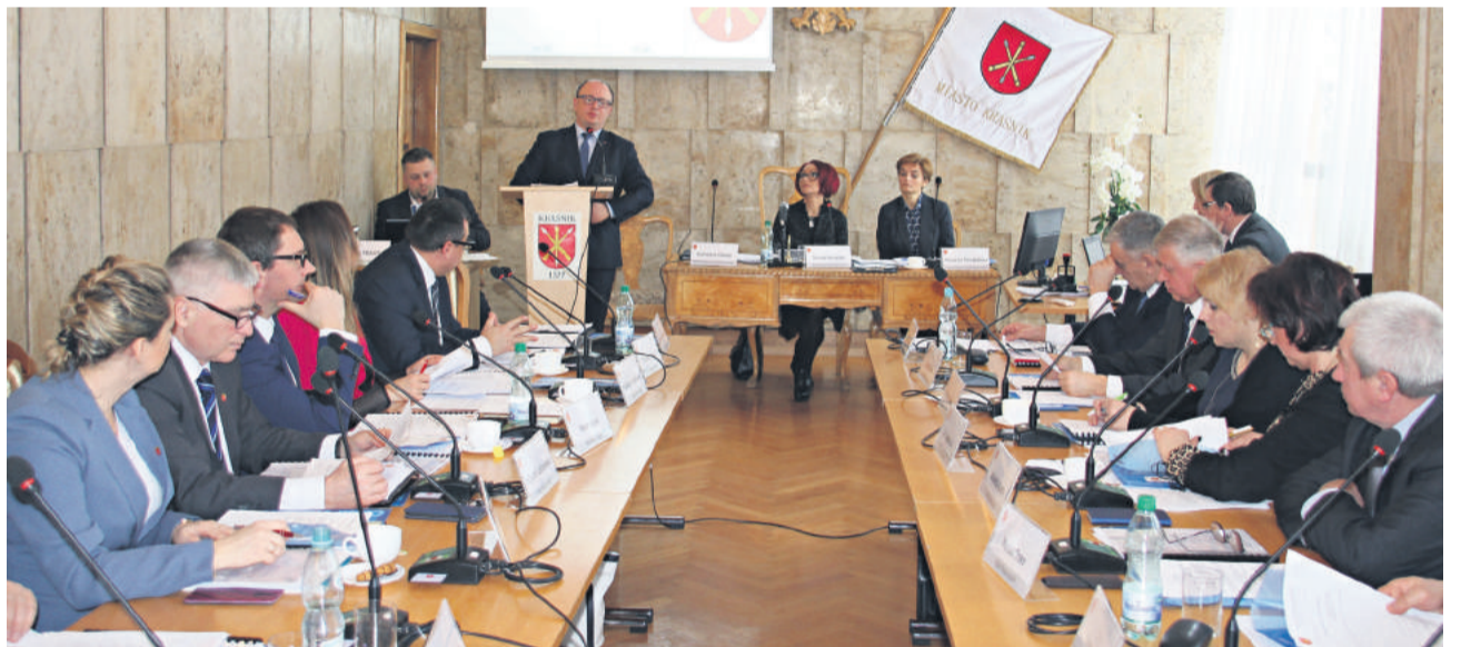
■ Na wniosek burmistrza radni zdecydowali o przeznaczeniu środków na Budżet Obywatelski.

Od 14.03.2019 r. do 27.03.2019 r. mieszkańcy mogą zgłaszać projekty. Wcześniej w poszcze-