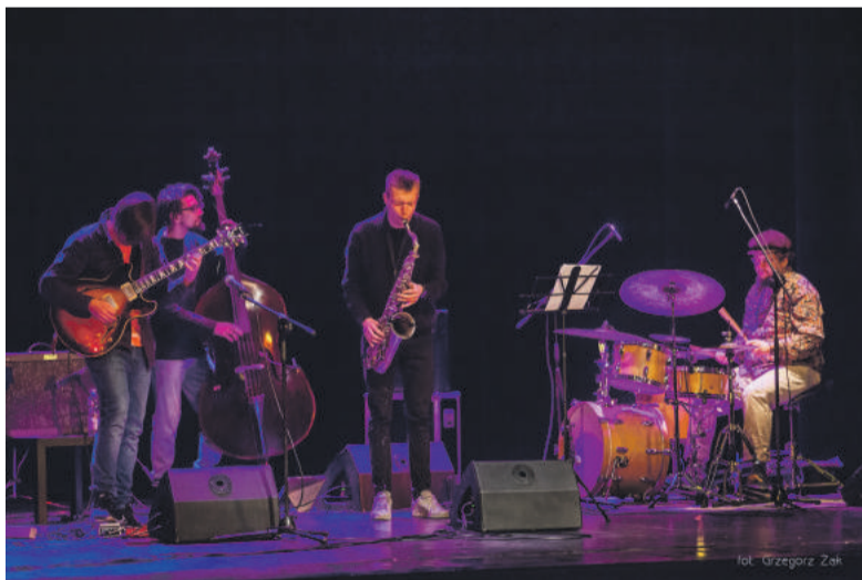
■ Polski jazz w ubiegłym roku rozbrzmiewał w murach CKiP wielokrotnie.

Centrum Kultury i Promocji od 7 listopada ubiegłego roku szczyli się go-dłem „Jazzowego Domu Kultury”, przyznawanego instytucjom promującym twórczość rodzimych muzyków jazzowych. Kraśnicki przybytek kultury wpisał się w to grono z chwilą przystąpienia do programu Polski Jazz 360°. Ten unikatowy, edukacyjno – koncertowy program, firmowany przez Fundację Polski Jazz i dofinansowany przez Ministerstwo Kultury i Dziedzictwa Narodowego, ma na celu obalenie stereotypu, że jazz to muzyka niszowa, trudna w odbiorze i nieprzystępna. Autorzy programu czynią to za pośrednictwem instytucji kultury takich jak CKiP, zapraszając publiczność do uczestnictwa w wydarzeniach artystycznych najwyższej próby i przybliżając odbiorcom to, co aktualne w polskiej muzyce jazzowej, cieszącej się uznaniem i szacunkiem na mię-