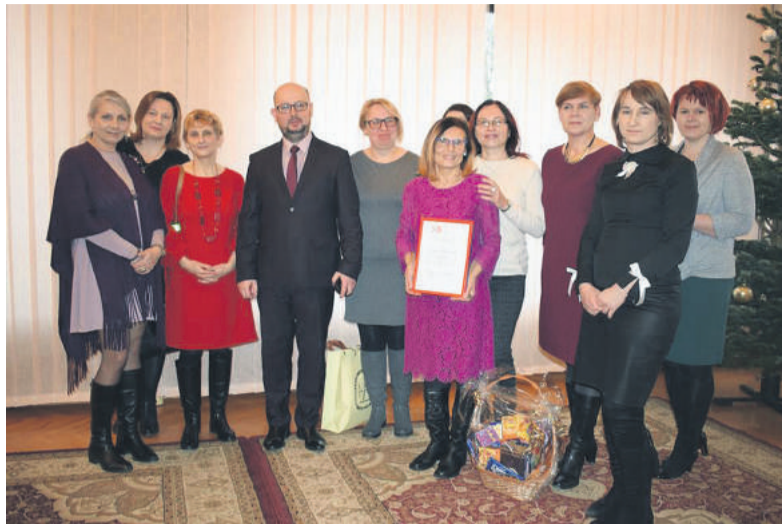
■ Kraśniccy bibliotekarze wraz z organizatorami konkursu „Biblioteka na 5”.

Ks. Zielińskiego 3 dzieje się naprawdę dużo. W każdy poniedziałek o godz. 16:00 odbywają się zajęcia plastyczne dla dzieci "Pędzelki" (prace są eksponowane w Galerii na Suficie), W każdy piątek o godz. 16.00 organizowane są zajęcia dla rodziców z dziećmi "Godzinki dla Rodzinki", raz w miesiącu - spotkania Dyskusyjnego Klubu Czytelniczego dla dorosłych "Salonik Literacki", a klub dla dzieci "Czytaczek" spotyka się w każdy ostatni czwartek miesiąca. Ponadto w ramach akcji "Bajeczki z Walizeczki" we wtorki bibliotekarz odwiedza świetlicę przy Miejskim Ośrodku Pomocy Społecznej i czyta dzieciom bajki oraz prezentuje bajeczki obrazkowe. W ramach akcji "Bibliotekarz w przedszkolu" raz w tygodniu w każdej placówce w