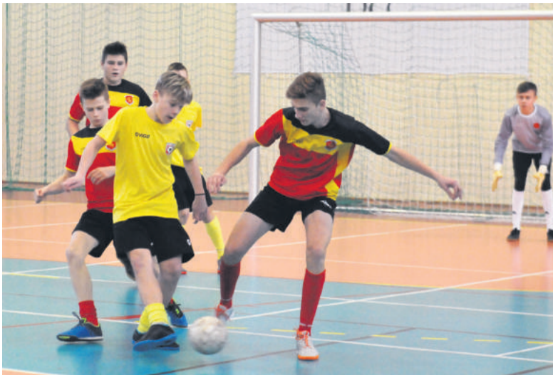
■ W finale turnieju zmierzyły się pierwszy zespół MUKS Kraśnik i Zawisza Garbów.

Najpierw zagrano w dwóch grupach, a później po dwie najlepsze drużyny z każdej z grup zmierzyły się w półfinałach. W pierwszym z nich MUKS Kraśnik I pokonał 3:0 Unię Wilkołaz, a w drugim Zawisza