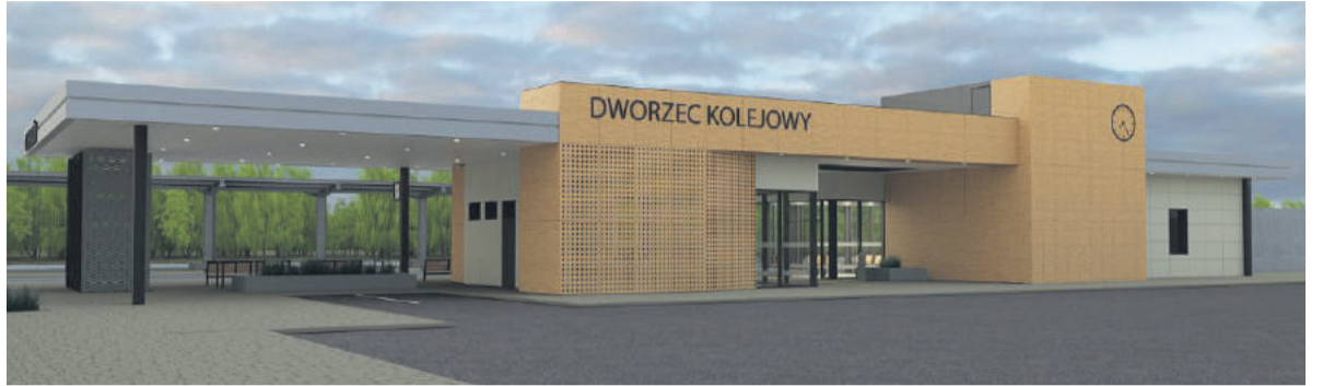
Zamiast obecnego dworca PKP w Kraśniku stanie nowoczesna bryła Innowacyjnego Dworca Systemowego.

W Kraśniku stanie większa wersja dworca, w której zaprojektowana została zamknięta poczekalnia wyposażona w klimatyzację. W budynku znaj-