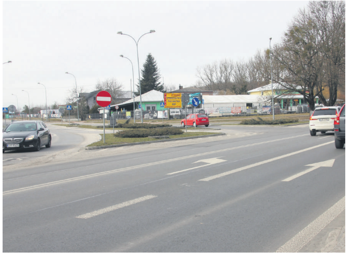
■ Skrzyżowanie ul. Granicznej i ul. Urzędowskiej. W tym miejscu w ramach remontu drogi 833 ma powstać jedno z dwóch turbinowych rond.

Jeśli chodzi o odcinek ul. Urzędowskiej od ul. Granicznej do osiedla Koszary, to jej lokalizacja nie zmieni się. Nie będzie to już jednak dłuższej droga wojewódzka, tylko lokalna – prawdopodobnie powiatowa.