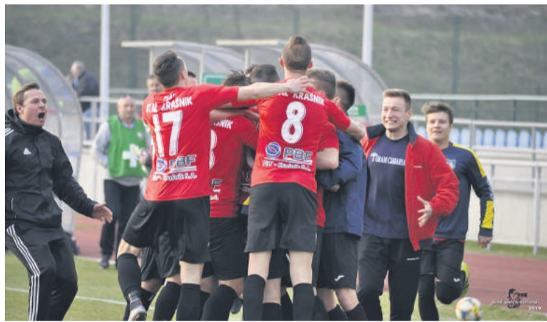
■ Pomimo tego, że przegrywali 0:2, to z Puław stalowcy wywieźli remis i jeden punkt.