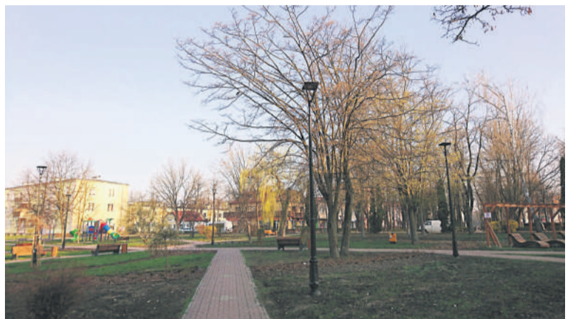
■ Nowe lampy pojawiły się m.in. w parku na ul. Sikorskiego.

ustawienia lamp. W kilku miejscach – jak na ul. Metalowców 3, czy Dekutowskiego „Zapory” – nie funkcjonowało to tak, jakby tego oczekiwali mieszkańcy. Problemem okazał się m.in. wybór niektórych lamp. Przygotowanie tej inwestycji, podobnie jak innych projektów w poprzednich latach, budzi obecnie obawy mieszkańców i władz. Stopniowo prace montażowe będą weryfikowane i do tematu powrócimy w kolejnym wydaniu ŻK.