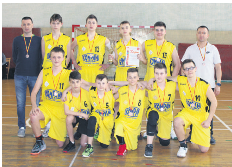
■ Na podium Mistrzostw Województwa stanęła m.in. reprezentacja Szkoły Podstawowej nr 2 (z lewej) i Publicznego Gimnazjum nr 1 (z prawej).