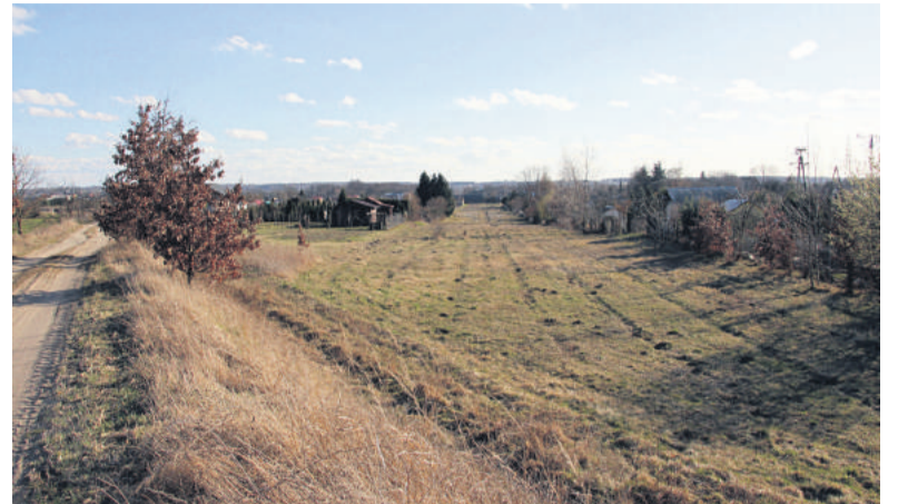
■ Na zdjęciu teren, który miasto planuje odkupić z przeznaczeniem na nowe działki rekreacyjne.

W związku z takim przebiegiem drogi część działkowców z „Marzenia” straci swoje ogrody i zostanie wywłaszczona: - Na nieru-