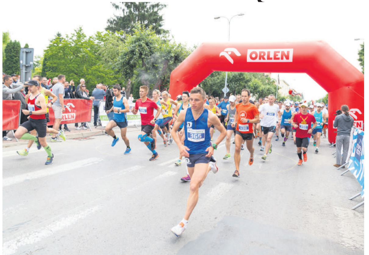
■ W tym roku, obok tradycyjnego Półmaratonu, rozegrany zostanie także pierwszy Maraton Kraśnicki.

I Maraton Kraśnicki zostanie rozegrany na dystansie 42,195 km, a IV Kraśnik Półmaraton – 21,0975 km. Organizatorem imprez jest Stowarzyszenie Strefa