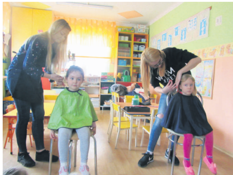
■ Uczennice ZDZ wystąpiły w roli fryzjerek, a maluchom bardzo podobały się ich nowe fryzury.

Młodzież z ZDZ zorganizowała również praktyczne warsztaty kulinarne i fryzjerskie dla maluchów. Dzieci wspólnie z uczniami przyrządziły zdrowe przekąski, a przyszłe panie fryzjerski czarowały na głowach przedszkolaków fantazyjne