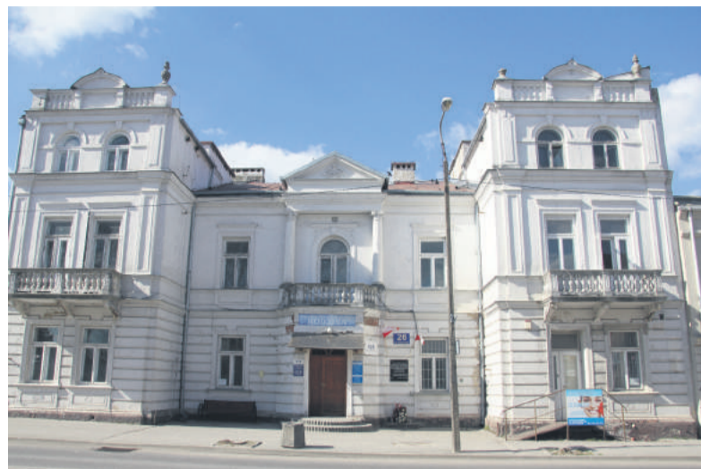
■ Tegoroczna rewitalizacja obejmie m.in. zabytkową kamienicę na ul. Kościuszki 26.