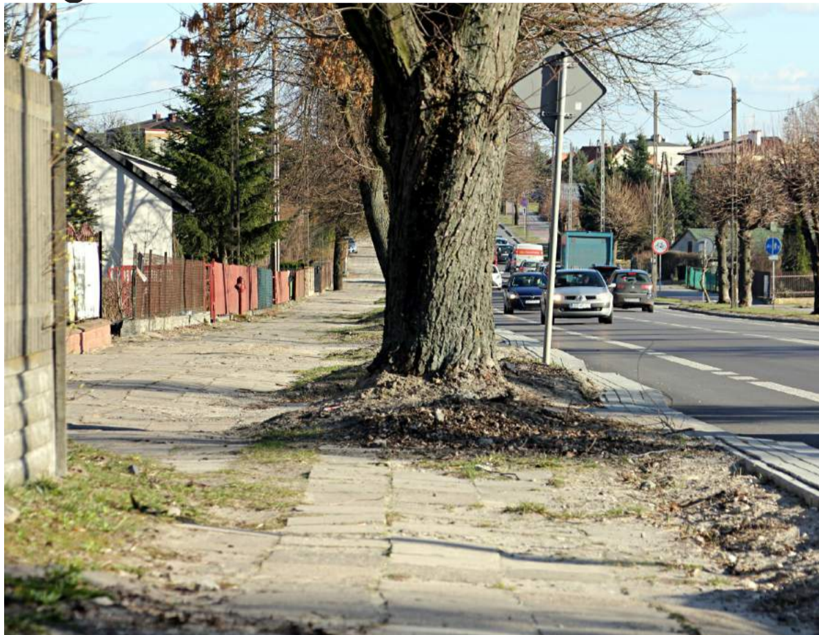
■ Przy ul. Urzędowskiej wyremontowany zostanie chodnik o długości prawie 3 km.

Przewidywany zakres prac remontowych obejmuje: odtworzenie i wymianę wszystkich elementów chodnika wraz z dojazdami do przejść dla pieszych, wzmocnienie nawierzchni na zjazdach, regulację wysokości, plantowanie terenu i zagospodarowanie zieleni.