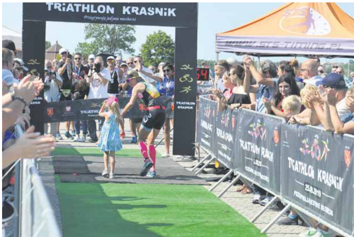
■ Na kraśnicki triathlon przyjeżdżają zawodnicy z całej Polski. Nie brakuje też kibiców, którzy dopingują startujących w tej wymagającej dyscyplinie sportu.

W tegorocznej edycji zwycięzca triathlonu na dystansie olimpijskim wyzna-