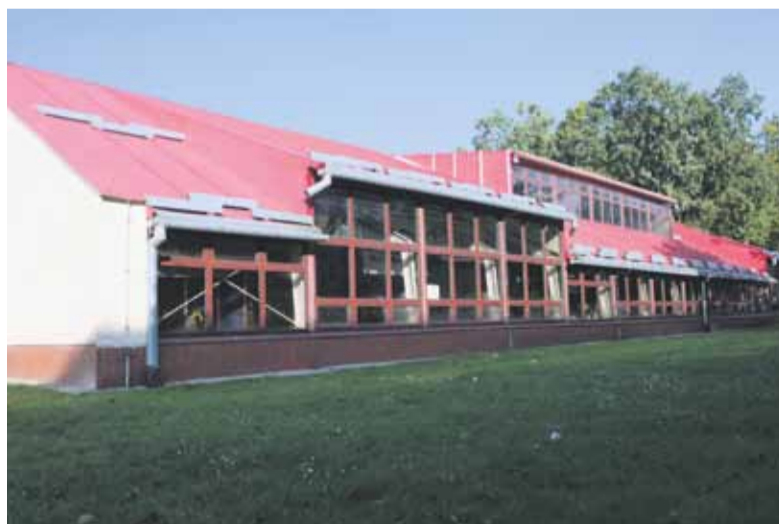
■ Kraśniczanie nadal mogą korzystać z krytego basenu.

Wgłędug zmian jakie naniesiono po sugestjach Urzędu Miasta nowy basen ma być obiektem przede wszystkim rekreacyjnym, przeznaczony dla całych rodzin. Dlatego w miejsce sali fitness, siłowni i poczekal-