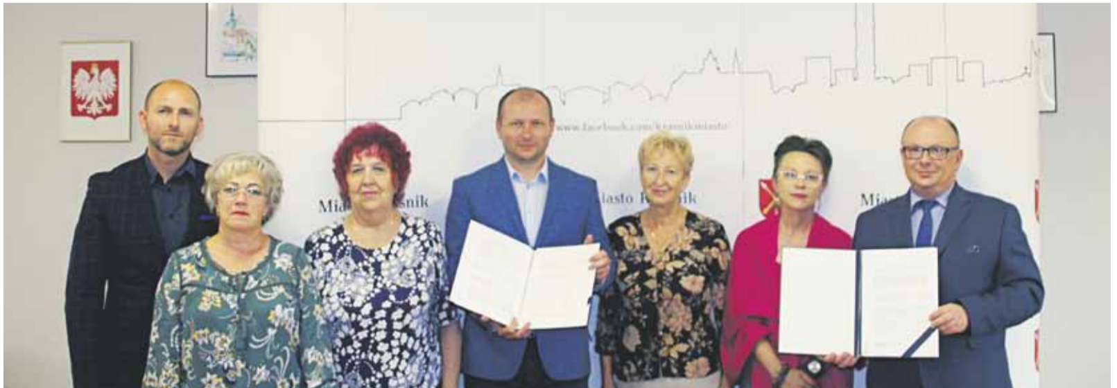
■ Umowa na świadczenie drobnych napraw osobom starszym została podpisana na początku września. Funkcjonownie programu było konsultowane z Radą Seniorów.

- Chcemy zaoferować seniorom darmowe świadczenie pomocy w nieskomplikowanych pracach domowych – wyja-