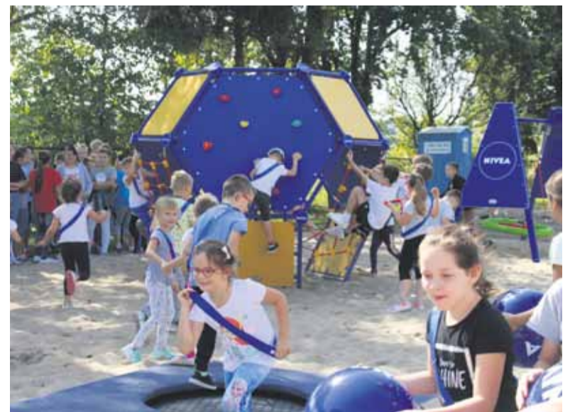
■ Ogólnodostępny nowy plac zabaw przy Szkole Podstawowej nr 3 „wywalczony” w internecie dzięki głosom kraśniczan cieszy najmłodszych już od jakiegoś czasu.

"Podwórko", które powstało, zastąpiło stary plac zabaw przy SP 3. Całość zafundowała firma Nivea. Jest ono ogólnodostępne w godzinach pracy szkoły, a więc od ok. godz. 6.00 do 20.00.