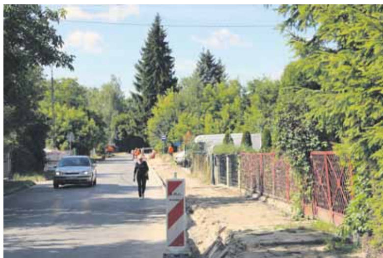
■ Budowa nowego chodnika przy ul. Podleskiej.