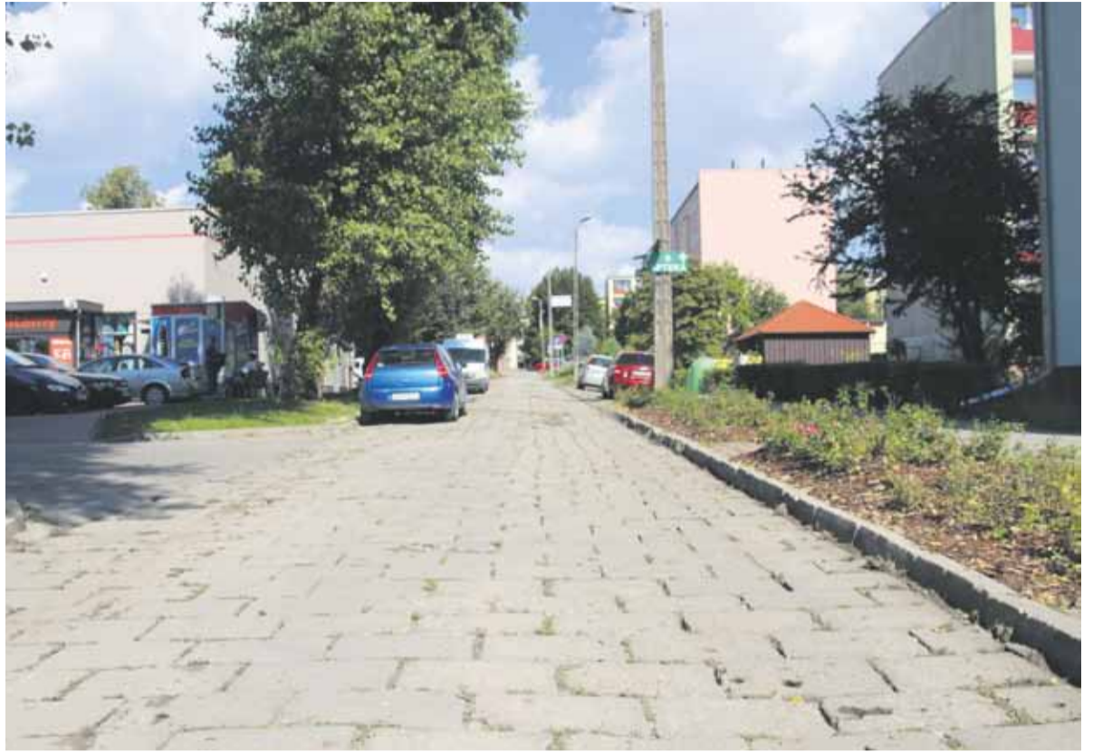
■ Miasto dzięki pozyskanym pieniądzą przebuduje m.in. ulicę Kopernika w dzielnicy starej Kraśnika.

Drugim planowanym zadaniem jest rozbudowa ul. Modrzewiowej w Kraśniku. Zakres inwestycji obejmuje budowę drogi o nawierzchni bitumicznej na długości 540 m i chodnika o szerokości 2 m. W tym przypadku koszt szacowany jest na 2,8 mln zł.