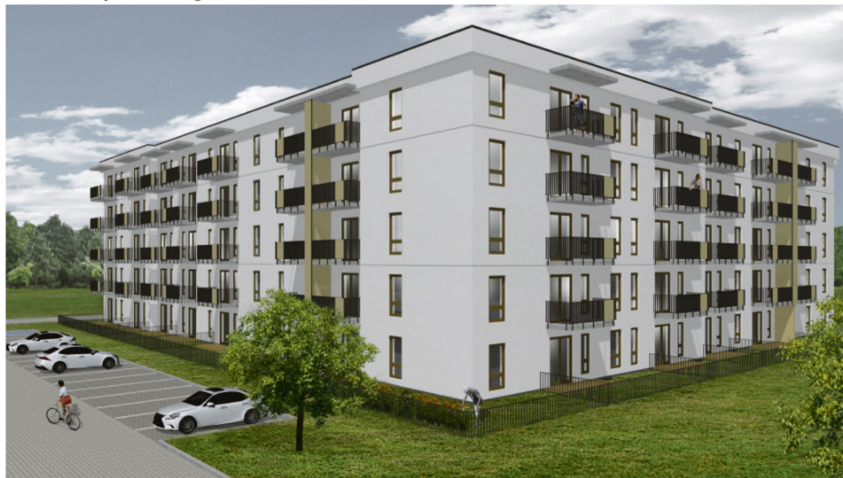
Blisko sto wniosków na wynajem mieszkań czynszowych złożyli mieszkańcy Kraśnika. Blok powstanie na os. Piaski.