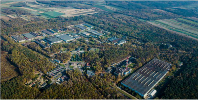
Fabryka ma do zaoferowania potencjalnym inwestorom ok. 30 ha atrakcyjnych terenów.

To tylko pierwszy etap zmian, bowiem docelowo liczba ta może wzrosnąć do 350.