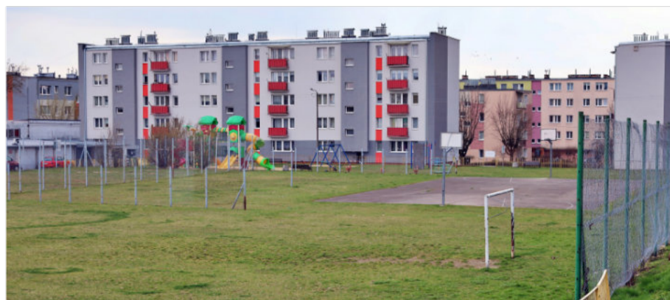
Przy ulicy Chopina powstanie parking na 60 miejsc wraz z terenami zielonymi.