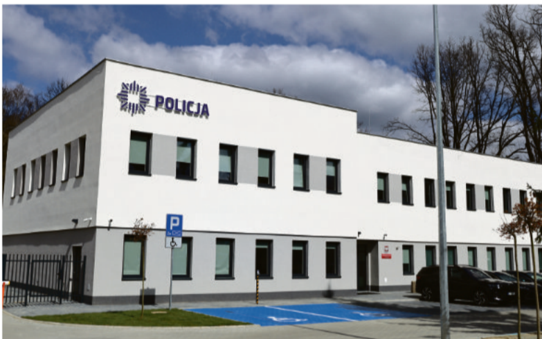
Na zdjęciu komisariat policji w dzielnicy fabrycznej na ul. Garażowej.