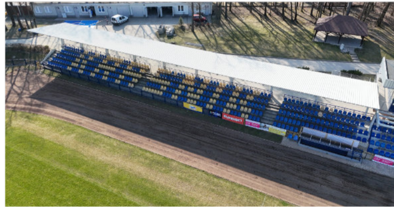
Marzenie kibiców o zadaszonych trybunach wreszcie się ziściło.