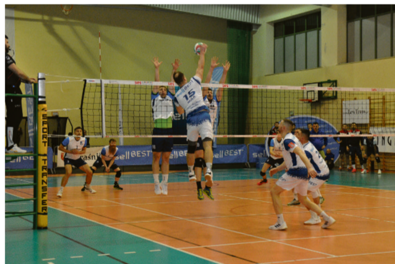
Zawodnicy MKS do samego końca walczyli o awans.

Dobra gra, dużo pozytywnych emocji i pełne trybuny na prawie każdym domowym meczu – taki był ten pierwszy po reaktywacji sezon seniorskiej siatkówki w męskim wydaniu w Kraśniku. Dziękujemy i gratulujemy zawodnikom, trenerowi, klubowi i sponsorom, którzy stoją za MKS sellBest Kraśnik.