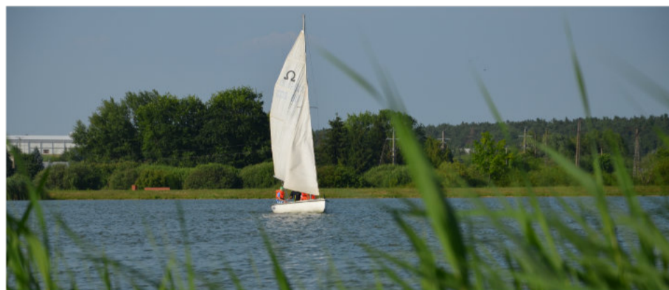
Utworzenie Regionalnego Centrum Turystyki i Wypoczynku w Kraśniku zakończy kilkuletni okres stagnacji nad Zalewem Kraśnickim.

24. Projekt remontu ulicy Różanej - osiedle domków rodzinnych w dzielnicy fabrycznej.