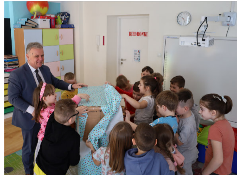
Nazwę „Wesołe Brzdące” wymyśliły kraśnickie przedszkolaki, którym w podziękowaniu burmistrz Kraśnika przekazał nagrody.