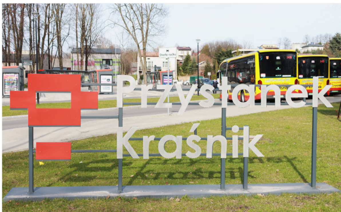
Autobusy MAN wyjechały na ulice Kraśnika w marcu 2024 r.

Wypłata środków została więc wstrzymana, a w tym czasie firma MAN wystawiała kolejne