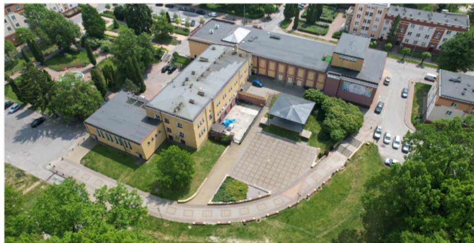
Dwa duże projekty rewitalizacji - siedziby głównej Miejskiej Biblioteki Publicznej oraz CKiP - umożliwią stworzenie nowej oferty kulturalnej dla mieszkańców miasta.