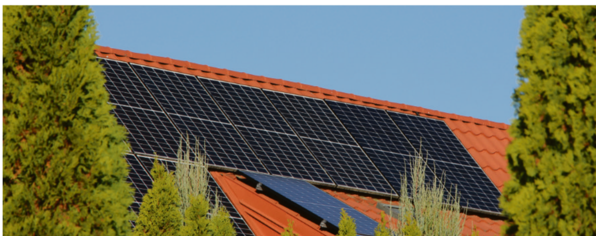
Kraśnicki projekt oferuje mieszkańcom miasta fotowoltaikę, magazyny energii, pompy ciepła na bardzo korzystnych zasadach.

- W przypadku samego miasta Kraśnik byłyby to 204 instalacje fotowoltaiczne, 163 magazyny energii i 97 pomp ciepła. To zna-