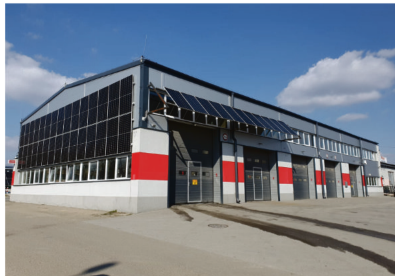
Dzięki dużej instalacji fotowoltaicznej MPK będzie mogło zaoszczędzić na eksploatacji elektryków.

Gdyby nowa instalacja fotowoltaiczna powstała rok temu, oszczędności w użytkowaniu elektryków byłyby większe.