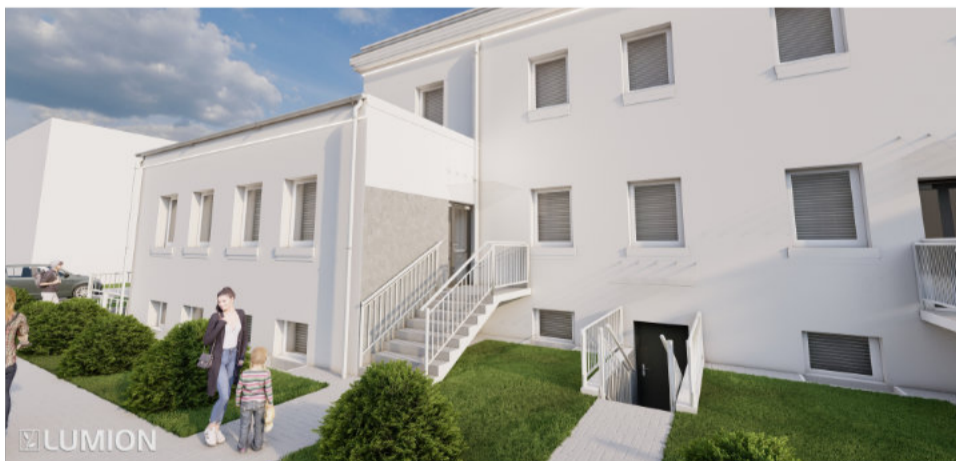
W planach inwestycyjnych znajduje się także termomodernizacja budynku komunalnego na ul. Sikorskiego 11.