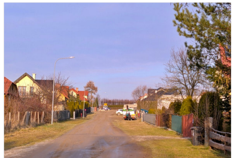
Dzięki dofinansowaniu Miasto zbuduje odcinek ul. Modrzewiowej wraz z kanalizacją deszczową.

Podczas spotkania w Urzędzie Wojewódzkim przedstawiciele Powiatu Kraśnickiego podpisali umowę na przebudowę ulicy Akacyjnej - drogi powiatowej na terenie gminy Kraśnik.